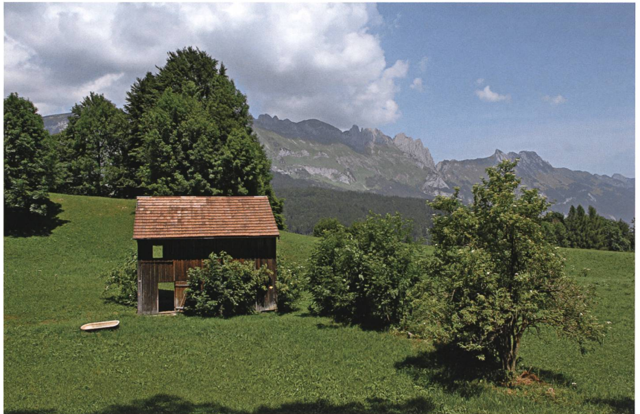
Einem Grabserberger brachte die nächtliche Begegnung mit einem Geist, der ihn bei einer abgelegenen Scheune anlief, nicht nur einen geschwollenen Kopf, sondern auch den baldigen Tod.

Unrecht gegenüber Gott und seinen Geboten führt die harte und oft unwiderrufbare Strafe herbei: das Versagen der Seelenruhe. Nicht nur Mordtaten lassen den Verbrecher nach dem Tod ruhelos werden, auch Meineid, Untreue gegen den Herrn, Betrug, Wucher und Diebstahl gelten im Volksglauben als Untaten, die nach schwerster Strafe verlangen. Menschen müssen als Wiedergänger erscheinen, wenn sie die Hand des irdischen Richters nicht erreicht hat. Selbst Geiz und Hartherzigkeit gegen Arme – nach dem geschriebenen Gesetz an sich keine strafbaren Handlungen – verletzen das Gerechtigkeitsgefühl des Volks und verlangen nach der gleichen Sühne. In den Sagen von Untaten und Strafe mischen sich demnach uralte Rechtsbegriffe und christliche Glaubenslehre. Es beruht auf heidnischen Vorstellungen, wenn die Verdammnis ewig ist. Erst der Gedanke an Sühne und Erlösung ist christliches Anschauungsgut, das die Glaubensvorstellung von den