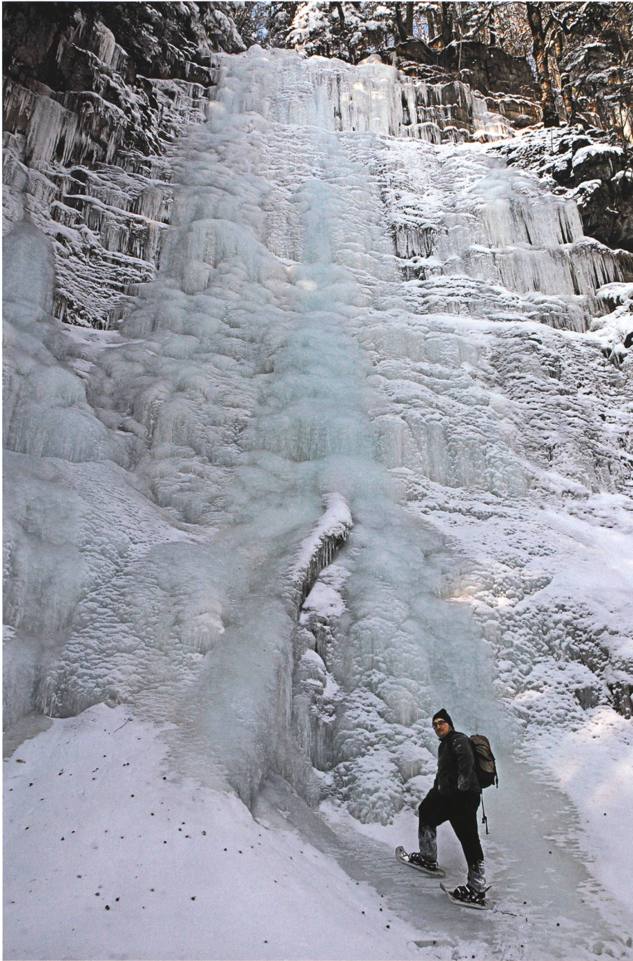
Geissbachfall im Buchserbachtobel im Februar 2012: Ein Köhler, der einst seinen Kumpel im Meiler verbrannt hatte, geistert hier als «Geissbachzopfi».

schwunden; er tauchte auch nie wieder auf. Der Geissbachzopfi hatte vor dem Verschwinden seines Kumpels noch einen Hornschlitten mit Holzkohle beladen und ins Zwischenlager nach Maladorf gezogen. In Buchs wartete der grosse Zahltag für die Kohle eines ganzen Sommers. Daher war im Dorf wohl