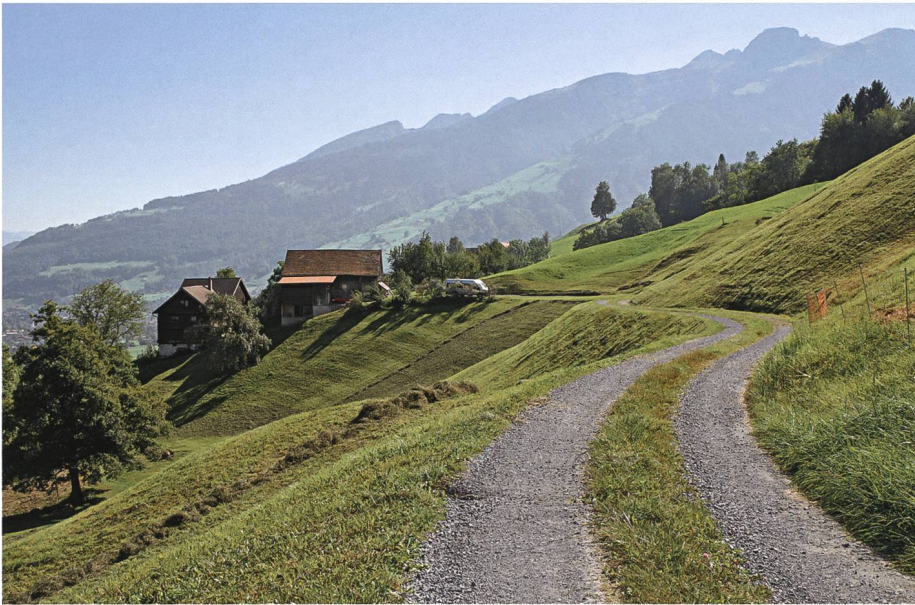
Im Körlibongert kann ein Gamserberger kaum mehr aufhören, Schläge auszuteilen; nach der Erlösung erwacht auch er mit geschwellenem Kopf.

te aber nicht, sondern musste immer weiter und weiter draufloshauen, bis du meinen Taufnamen gerufen hast. Da war ich erlöst.» Am nächsten Morgen waren Kopf und rechte Hand des Mannes stark geschwollen.