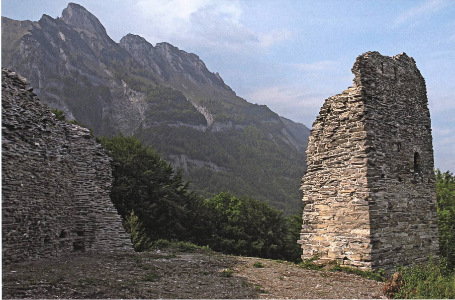
Im dunklen Gemäuer der Ruine Hohensax wartet ein verwünschtes Fräulein auf die Erlösung.

einen kleinen Käse erblickt. Er lobt im Stillen die Art der Vorsorge unter den Menschen. Nachdem der ungeheissene Wächter auch noch einen Blick ins leere Schlafgemach getan hat, verlässt er die Hütte, und bald schon verhallen die Tritte seiner Schuhe mit den buchenen Sohlen in der Nacht.