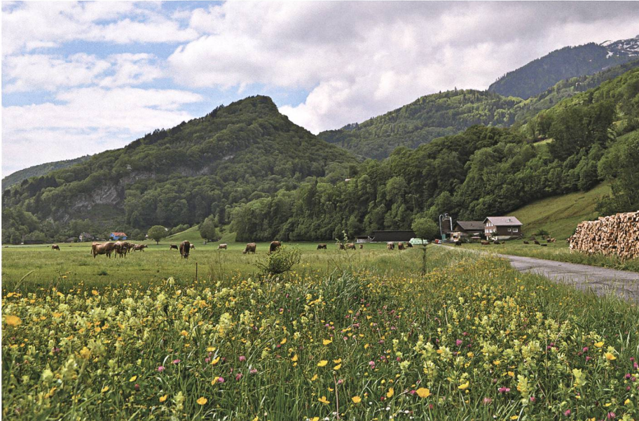
Die Erfüllung einer dreiteiligen Mutprobe führt beim Falnättschastadel zur Erlösung eines verwunschenen Mädchens.

hinab und sprich das Fräulein an! Frag es, ob du es erlösen kannst! Es sieht so aus, als ob wir in dieser Nacht noch zu reichen Leuten würden.»