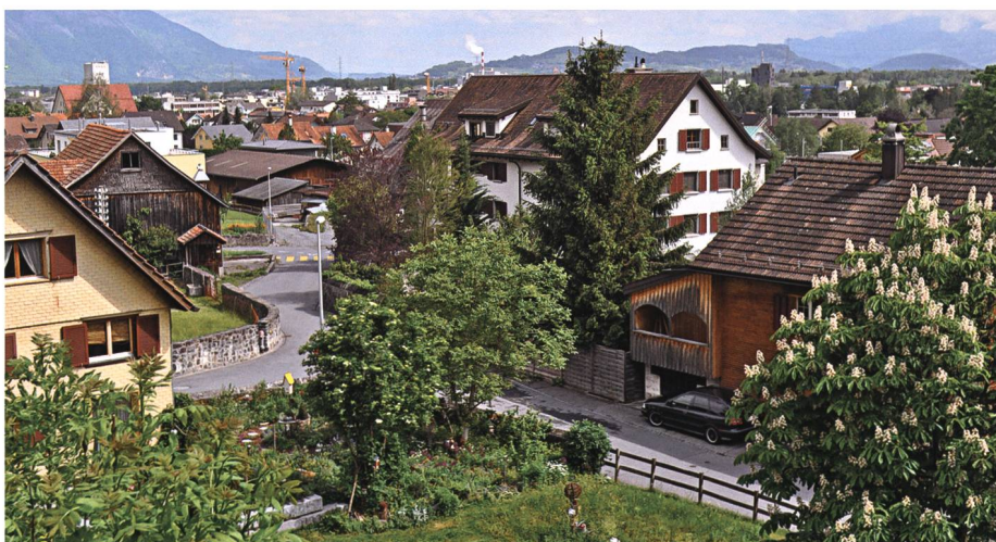
Bei der Stigele in Buchs: Ein Verwünschter hätte hier durch ein drittes freundliches Wort erlöst werden können.