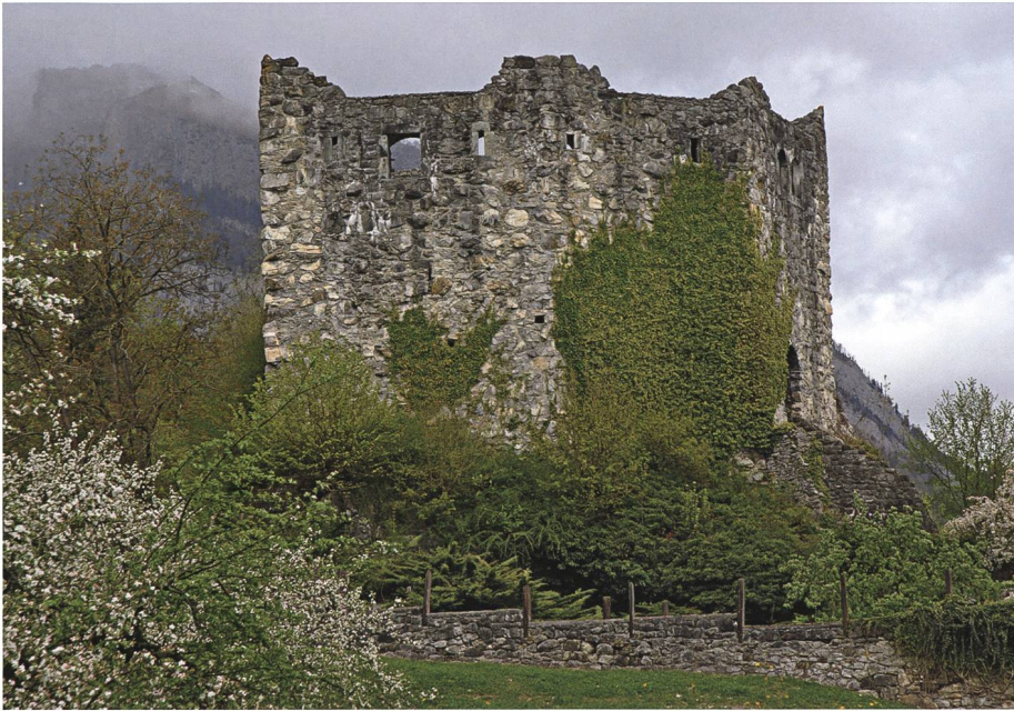
In den Gewölben der Burg Forstegg wartet eine Kiste voll Gold auf einen mutigen Erlöser.

Das Bewusstsein, dass Schatzgraben einer obrigkeitlichen Bewilligung bedarf, scheint aber schon früh vorhanden gewesen zu sein. Wer heute mit dem Metalldetektor auf Schatzsuche geht, macht sich in dem Moment strafbar, wo er den Spaten ansetzt, um zu schauen, warum es gepiepst hat. Raubgräberei ist illegal, weil sie auf unwie-derbringliche Weise archäologische Denkmäler zerstört, denn im Boden verborgen befindet sich sozusagen das historische Archiv unserer Kultur. HG