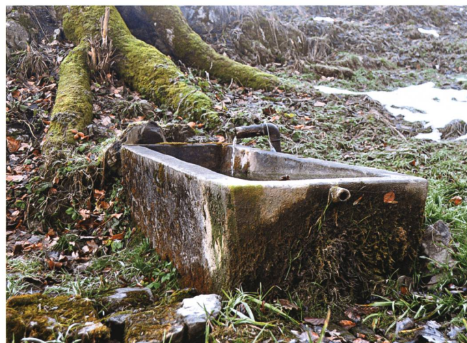
Alter Tränkebrunnen im Selfa: Handelt es sich vielleicht um das versiegte Goldbrünnlein am Brögstein?

Als sie am Morgen ihre Schürze ausschüttelte, sah sie mit Schrecken, dass der Kohlestaub golden war und ein paar winzige Körnchen baren Goldes sich in den Fäden verfangen hatten. Das schreckte sie auf. Wie ein Reh eilte sie zum Fuss der Tunggelgass zurück, jedoch waren weder Kohle noch Gold mehr zu finden!