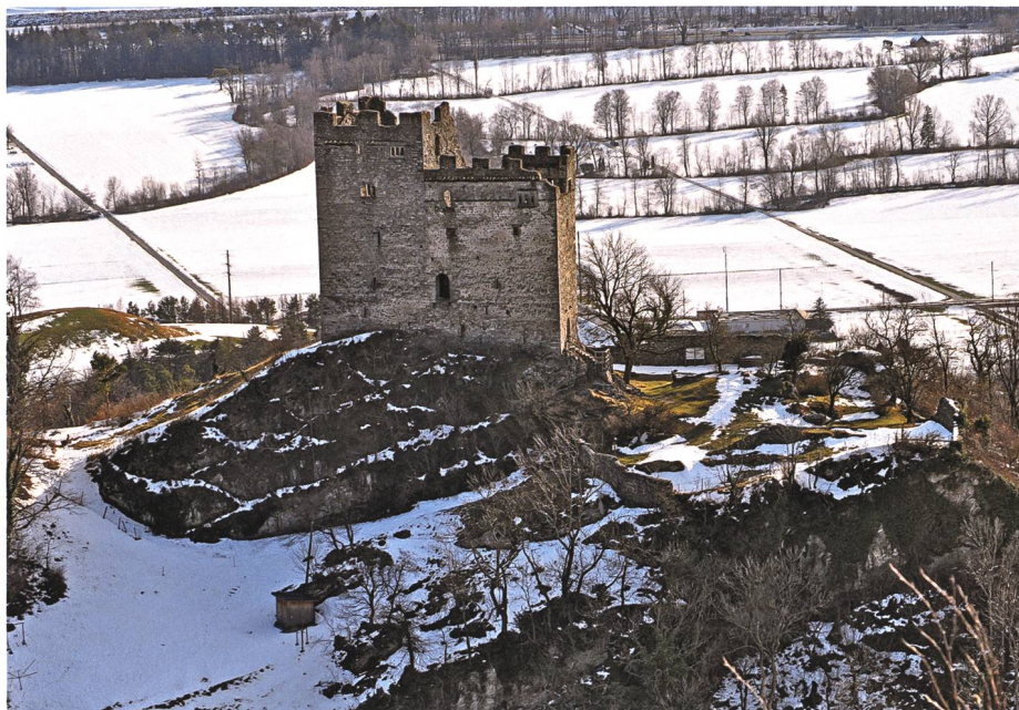
Burghof der Ruine Wartau: Blätter der einst dort wachsenden Blutbuchen verwandeln sich in lötiges Gold.

Seit Jahrhunderten waren Vorstellungen, wie man zu einem nie leer werdenden Geldbeutel kommt, wie man einen Geist oder den Teufel dazu zwingen kann, Geld zu geben, oder wie man einen Spiegel herstellt, in dem man im Boden vergrabene Schätze zu entdecken weiss, Bestandteile der Volkskul-