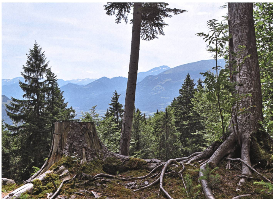
Im wasserzügigen Waldgebiet oberhalb der Learos hört man in Herbstnächten das Drehen eines Spinnrades.

Seit dem Altertum kennt die Gesellschaft die Tötung des Nachwuchses in Zeiten der Not, des Hungers oder aus anderen Beweggründen. In der griechischen Mythologie erdolcht die Königstochter Medea ihre eigenen Söhne, um sich an ihrem Mann zu rächen. Die Kindsmörderinnen der frühen Neuzeit und des 18. Jahrhunderts waren dagegen nicht mehr privilegierte und grausame Königstöchter, sondern entstammten meist niederen Schichten. Vom Mittelalter bis in die Neuzeit kam es nicht selten vor, dass Eltern ihr Kind umbrachten, da sie es nicht zu ernähren vermochten. Motiv war häufig auch die Scham und die Angst vor Ehrverlust und Schande. Vor allem im 17. und im 18. Jahrhundert stieg die Zahl der Morde an neugeborenen ausser-ehelichen Kindern, da die Frauen öffentliche Züchtigungen und den Pranger fürchten mussten. Die bekannteste Kindsmörderin dieser Epoche ist Gretchen aus Goethes «Faust», die ihrem unehelich geborenen Sohn das Leben nimmt. Auch das Wartauer Selfafröuli