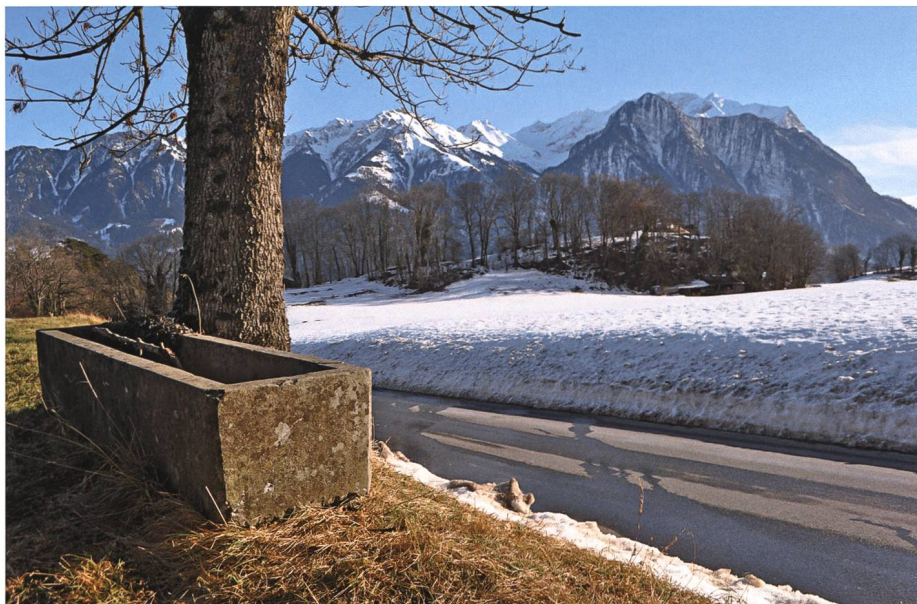
Beim Chropfenbrünnli, einer verrufenen Stelle bei Oberschan, schreckt eine mächtige Färlisau mit unzähligen Ferkeln die Menschen.

Dass es nicht ratsam ist, um Mitternacht am Selfabächli vorüberzuwandern, wenn man sich am Martinimarkt in jugendlichem Feuer und in froher