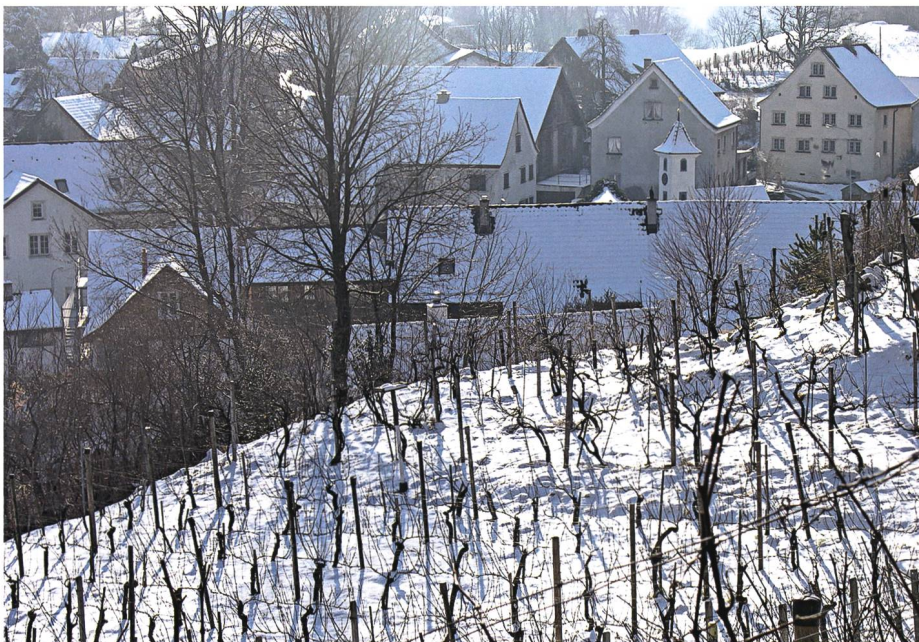
Der Dorfkern von Fontnas mit dem Weinberg Munt. Die von selbst aufgehende Stubentür und ein geheimnisvoller Schatten kündeten den Tod der Tochter auf dem Weg ins ferne Preussen.