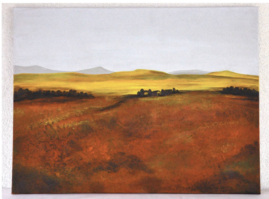
Spannendes Zusammenspiel der Farben: Eine Landschaft in der Bretagne.