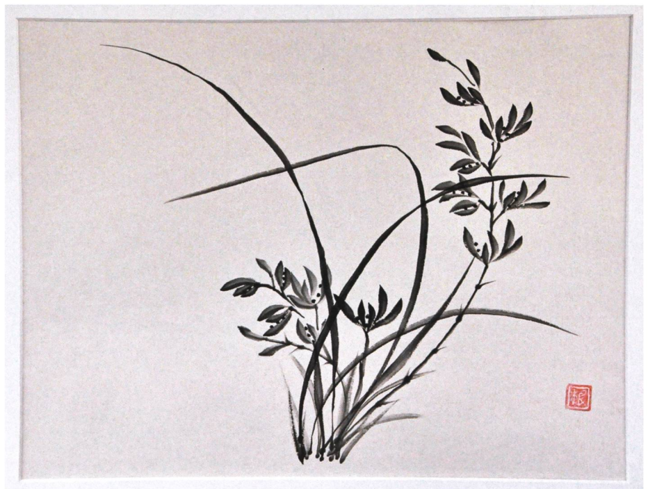
Filigranes in Sumi-e: Die Orchidee bedeutet Reinheit.