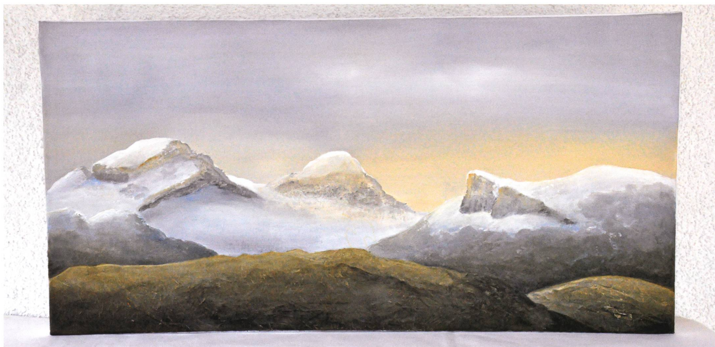
Werdenberger Motiv: Gauschla, Alvier und Ferschmutchopf.

Ebenso – und das dann in positivem Sinn – hat sie die strengeren Bestimmungen (stronger rules) im Bild festgehalten, die Liechtenstein als erstes Land nach den happigen Vorwürfen, das Land ermögliche Steuerhinterziehung, eingeführt hat. Ruth Giger be-