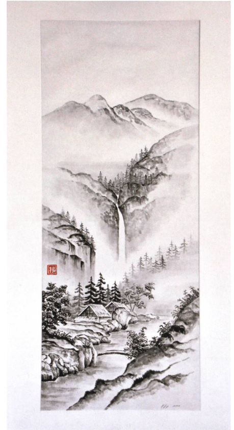
Bild mit viel Symbolkraft: Japanische Bauernhäuser zwischen Fels, dem männlichen Element Yang, und Wasser, dem weiblichen Element Yin.

Auf Studienreisen nach China und Japan besuchte sie Künstler und Museen. In einem Museum in Dunhuang im Nordwesten von China traf sie einen Künstler, der seine Bilder für eine Ausstellung in der National Galerie in Peking vorbereitete. Nach einer intensiven und interessanten Diskussion über die chinesische und europäische Kunst fertigte der Künstler eine Kalligrafie