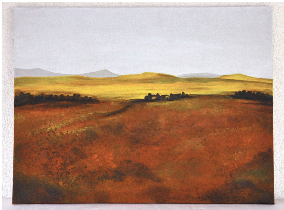
Spannendes Zusammenspiel der Farben: Eine Landschaft in der Bretagne.