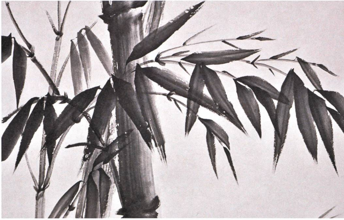
Detail eines beliebten Motivs in Sumi-e-Technik: Bambus bedeutet Treue und Freundschaft.