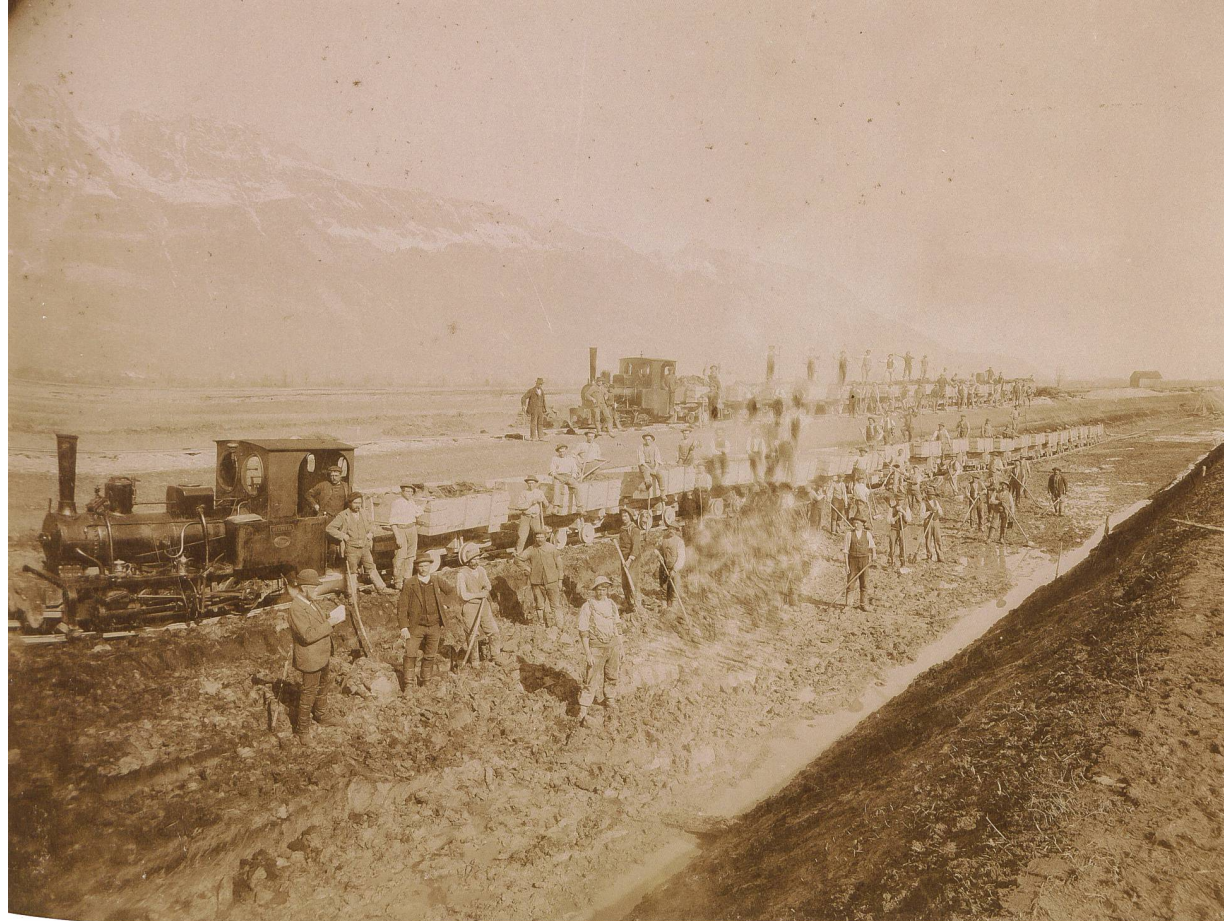
Das vom Kanton St.Gallen 1835 erlassene «Gesetz über Abtretung von Privateigentum für öffentliche Zwecke» rückt das Gemeinwohl in den Vordergrund. Den Hintergrund dazu bilden unter anderem die ab dem 19. Jahrhundert ausgeführten Gewässerkorrekturen wie jener der Simmi (Bild) 1902 bis 1905.