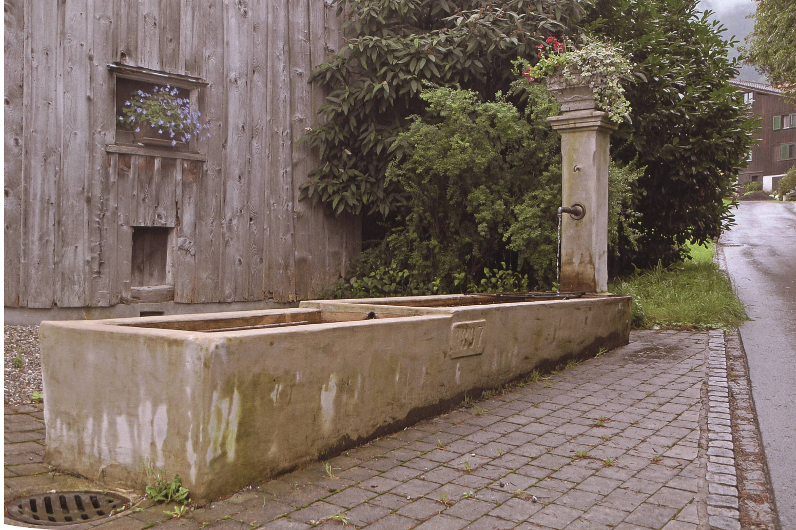
Ein typischer Vertreter seiner Zeit: der Othmersbrunnen an der Staudenstrasse in Grabs mit der Jahrzahl 1897.

se eine Haltung, die den modernen Staat und die freie Wirtschaft ablehnte. Jede organisatorische Anpassung an gewandelte Wirtschafts- und Sozialstrukturen wurde als verletzender Eingriff in kirchliche Rechte betrachtet. Konstruktive Mitarbeit im Staat fand daher wenig statt, wie einem Bericht über die Gründung der konservativen Partei entnommen werden kann: 55