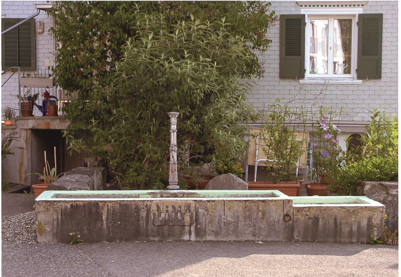
Der Brunnen an der Staatsstrasse im Ögistriet in Sennwald trägt die Jahrzahl 1898, des Gründungsjahres der Brunnenkorporation Lögert-Eugstisriet.

gige Stickerie Mitte der 1880er Jahre umso härter getroffen. Überproduktion führte zu einem verheerenden Konjunkturunbruch. Vorerst vorbei waren die Zeiten, als die Stickerie dank der Eroberung des amerikanischen Marktes mit Aufträgen überhäuft worden war. Eine kurze Erholungsphase zeichnete sich Ende der 1880er Jahre ab, jedoch verschlechterte sich die Konjunktur ab 1890 erneut. Politische Folgen liessen nicht lange auf sich warten. Forderungen nach staatlichen Interventionen wurden laut. Der liberale Staat reagierte nur zögerlich auf derartige Anliegen. 58 Das starre Festhalten an liberalen Prinzipien hatte mitunter zur Folge, dass sich die erstarkten Demokraten und die Konservativen in ihren Zielen annäherten und sich so das politische Gewicht allmählich zu verla-