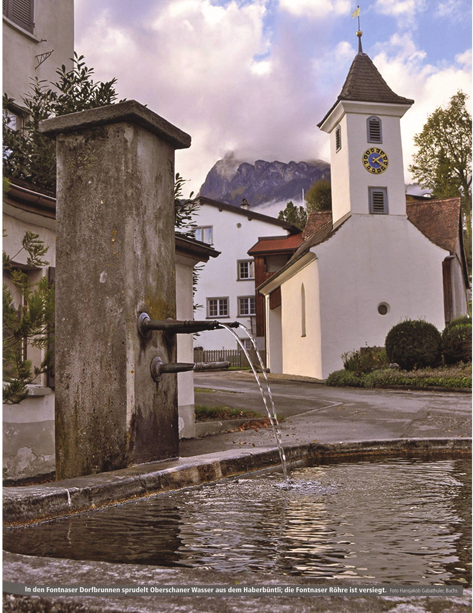
In den Fontnaser Dorfbrunnen sprudelt Oberschaner Wasser aus dem Haberbüntli; die Fontnaser Röhre ist versiegt.