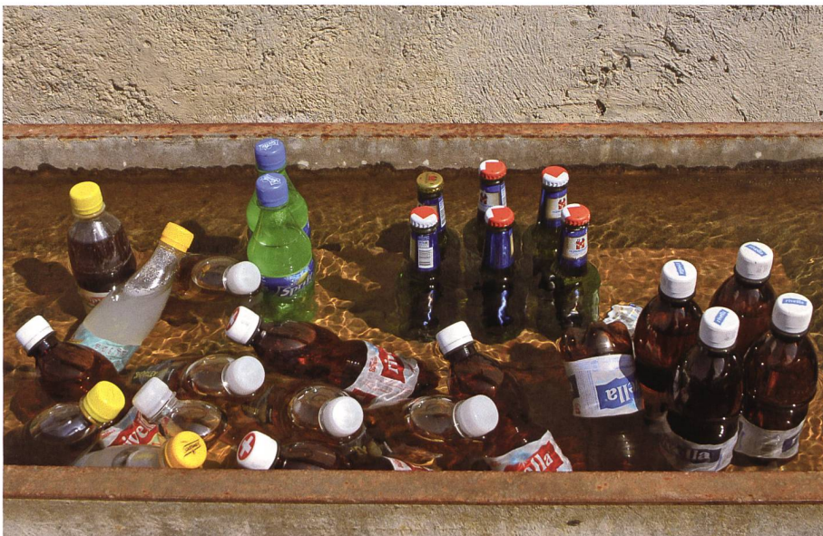
«Getränkekühler» an einem Werdenberger Wanderweg: Hahnenwasser weist in der Schweiz eine nicht schlechtere Qualität auf als abgefüllte Wasser.

Das Hahnenwasser in der Schweiz beispielsweise weist eine nicht schlechtere Qualität als das abgefüllte Wasser auf. Faktisch ist es in gewissen Regionen sogar so, dass das Hahnenwasser von besserer Qualität ist. 21 Es gibt also von der Produktqualität her keinen