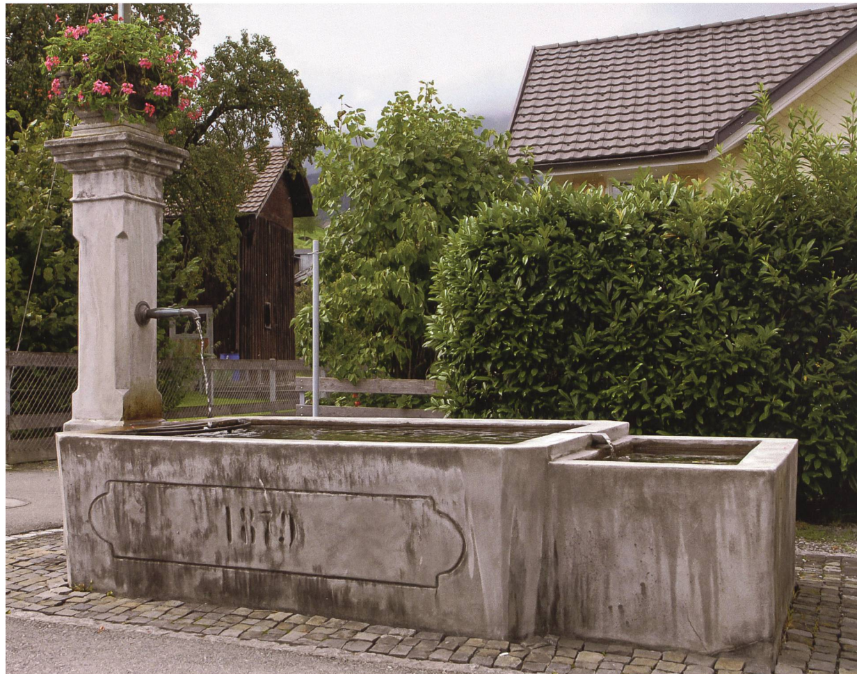
Nicht wenige Brunnen in den Werdenberger Dörfern tragen Jahrzahlen aus der Zeit des Ringens um die st.gallische Wasserrechtssetzung. Der Geisseggbrunnen in Grabs von 1879.