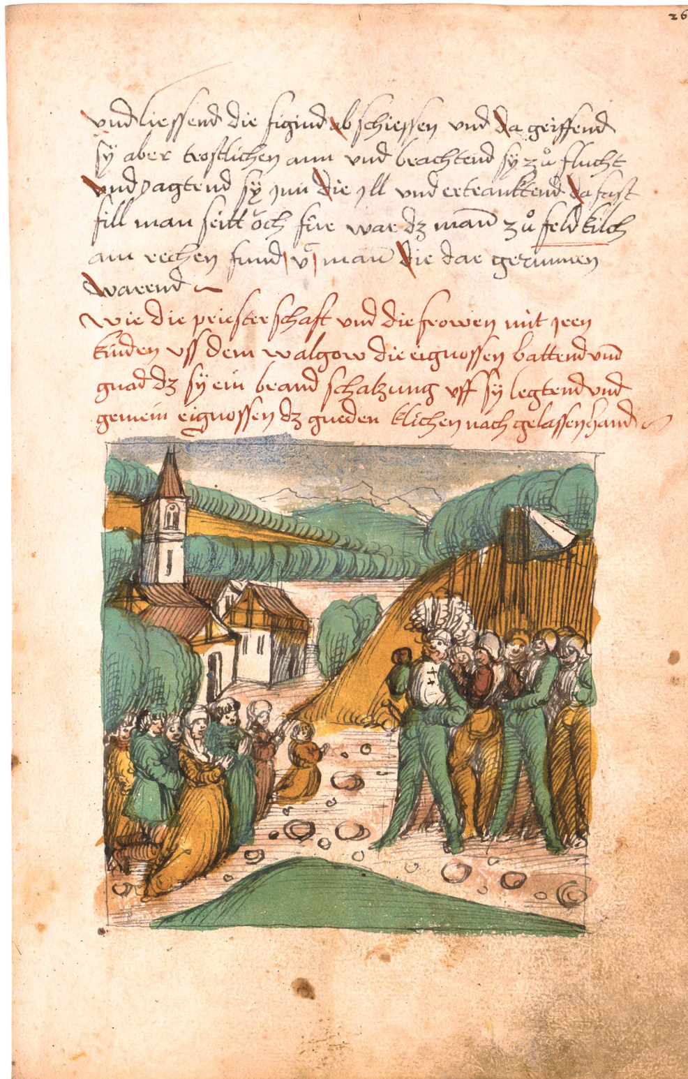
Abb. 3. «Wie die priesterschaft vnd die frowen mit iren kinden vss dem Walgow die eignossen battend vmm gnad, dz sy ein brandschatz vff sy leggend vnd gemein eignossen dz gnedklichen nachgelassen hand». – Die Bevölkerung hatte schwer unter den Raubzügen der Kriegsparteien zu leiden und nicht immer fanden ihr Bitten um Gnade Gehör. Dorfbewohner mit ihrem Priester bitten die Eidgenossen nach der Schlacht bei Frastanz im April 1499 um Auferlegung einer Brandschatzungssumme und Verzicht auf Plünderungen und Verwüstungen.

Unsere Gewährsleute sind sich über die Vorgänge bei der Besetzung von Maienfeld durch die schwäbischen Bundestruppen und die Rolle der Brandiser dabei also keineswegs einig. Ob die Version einer geordneten Übergabe der Stadt, die der Besonnenheit Ludwigs und seines Bruders Sigmund II. von Brandis zu verdanken wäre, oder diejenige, der einen hohen Blutzoll bei der Bündner Besetzung geforderten Erstürmung, die dem brandisischen Bastarden und Verräter Hans Nigg zuzuschreiben wäre, der Wahrheit näher kommt, ist letztlich kaum zu entscheiden. Denn eine Parteinahme für oder gegen eine der beiden Konfliktparteien dürfte auch die Einschätzung des Verhaltens der Brandiser nicht unwesentlich beeinflusst haben. Auffallend bleibt immerhin einerseits die anscheinend völlige Unkenntnis des Verfassers der Acta hinsichtlich einer gewaltsamen Einnahme von Maienfeld, andererseits die zentrale Rolle, die von den übrigen zitierten Quellen dagegen Hans Nigg von Brandis dabei zugemessen wird – von dem noch bei der Erstürmung der St.Luzisteig tatkräftig mitwir-