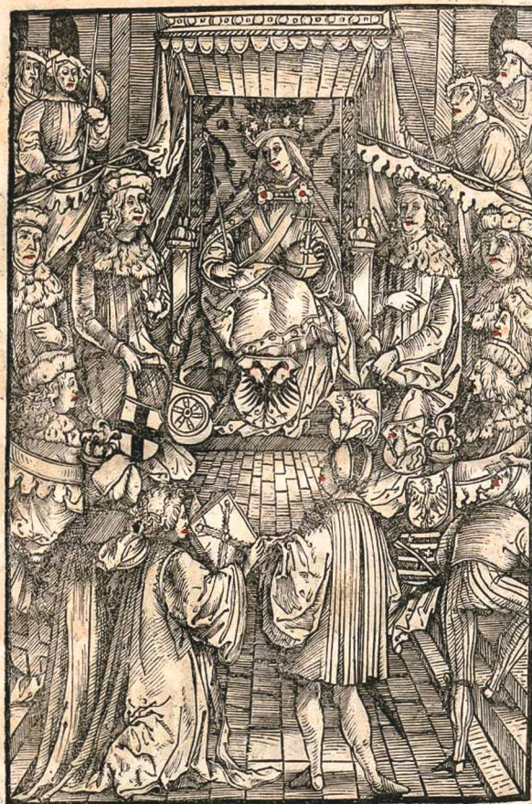
Abb. 1. Als Informationsquelle zum Schwaben-/Schweizerkrieg 1499 kommt der Chronistik grosse Bedeutung zu. Petermann Etterlin widmet seine 1507 in Basel als erste im Druck erschienene Schweizerchronik dem Römischen Reich und übergibt sie Kaiser Maximilian und den sieben Kurfürsten.

Am 4. März 1499 antwortete die Stadt Bern seinem in Luzern in einem Wirtshaus in Arrest 6 einquartierten Bürger, dem Freiherrn Ludwig von Brandis, auf eine an sie erhobene Beschwerde, dass seine Gefangennahme ihr nicht minder leid täte, als wenn sie einem Eidge-