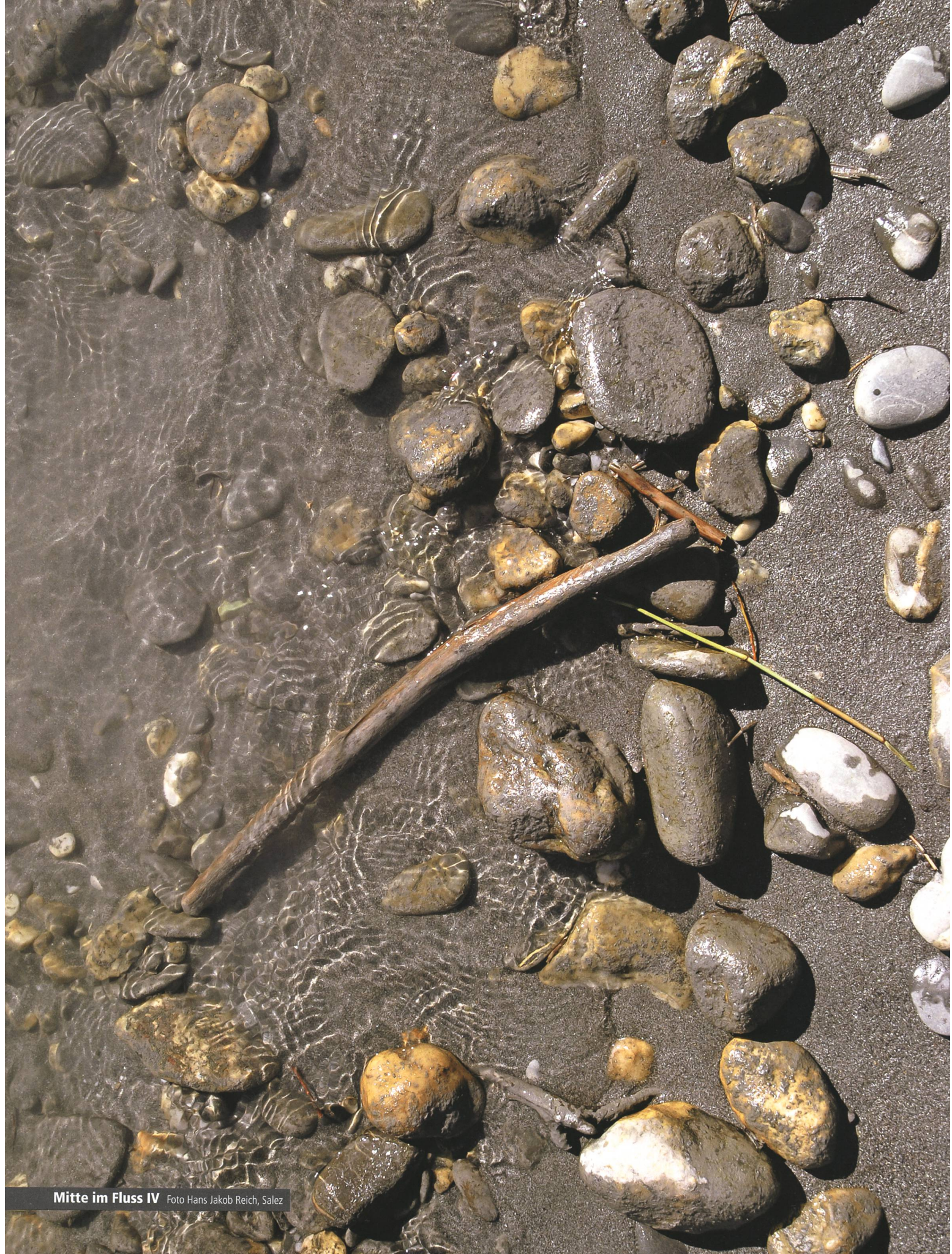
Mitte im Fluss IV