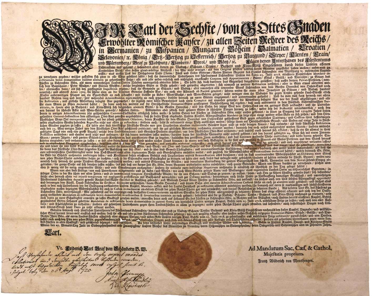
Der unrechtmässige Verkauf von Rechten und Gütern durch Graf Jakob Hannibal von Hohenems führte am 27. Juli 1720 zum Befehl Kaiser Karls VI., diese sogenannten Dominikalgüter an die neuen Landesherren zurückzugeben.

Dem Absolutismus gelang es nicht, zukunftsweisende wirtschaftliche, soziale oder auch nur politische Reformen durchzusetzen. Ein wichtiges Hindernis war, dass die Obrigkeit immer ihre eigenen wirtschaftlichen Interessen in den Vordergrund stellte: Die Sicherung der Abgaben und der gewerblichen Monopole, die nach wie vor auf