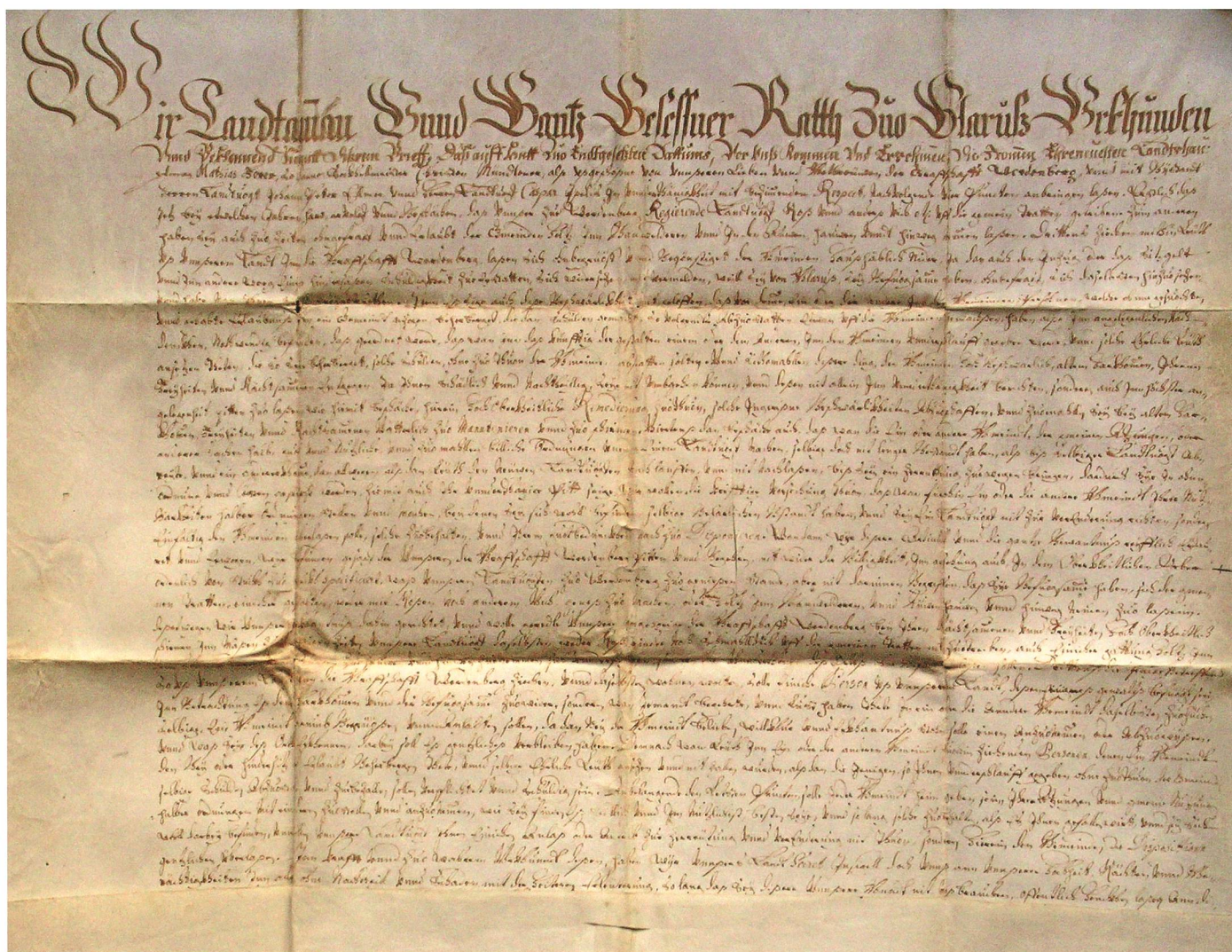
Im «Freiheitsbrief» vom 17. Januar 1667 anerkannte der Rat von Glarus verschiedene Rechte der Gemeinden in der Grafschaft Werdenberg. 1705 forderten die Glarner den Brief zurück und 1722 – nach den Unruhen im Landhandel – entsiegelten und zerschnitten sie ihn und machten ihn «unnützig». Der Schnitt hierfür ist leicht rechts von der Mitte zu erkennen.

Wälder), weiter die Erstellung und der Unterhalt der Rheinwuhre, von Strassen und Brücken und die Versorgung von Armen. Die sogenannten Legbriefe waren Ausdruck einer bemerkenswerten Selbstverwaltungskompetenz der Werdenberger Untertanen, da diese weitgehend autonom über die Nutzung der Gemeindegüter bestimmen konnten. Erst mit der Remedur von 1725 wurde dafür die Zustimmung der Obrigkeit erforderlich gemacht. Organe der Gemeinden waren die Gemeindeversammlung, der Seckelmeister, der Steuervogt und diverse Geschworene, die von der Gemeindeversammlung gewählt wurden. 36