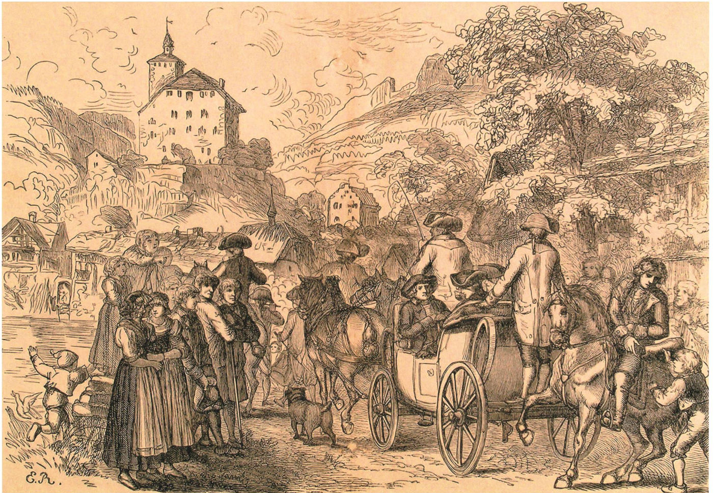
Feierliche Inszenierung des Amtsantritts: Aufritt des Landvogts in Werdenberg. Xylografie von Emil Rittmeyer, um 1870.