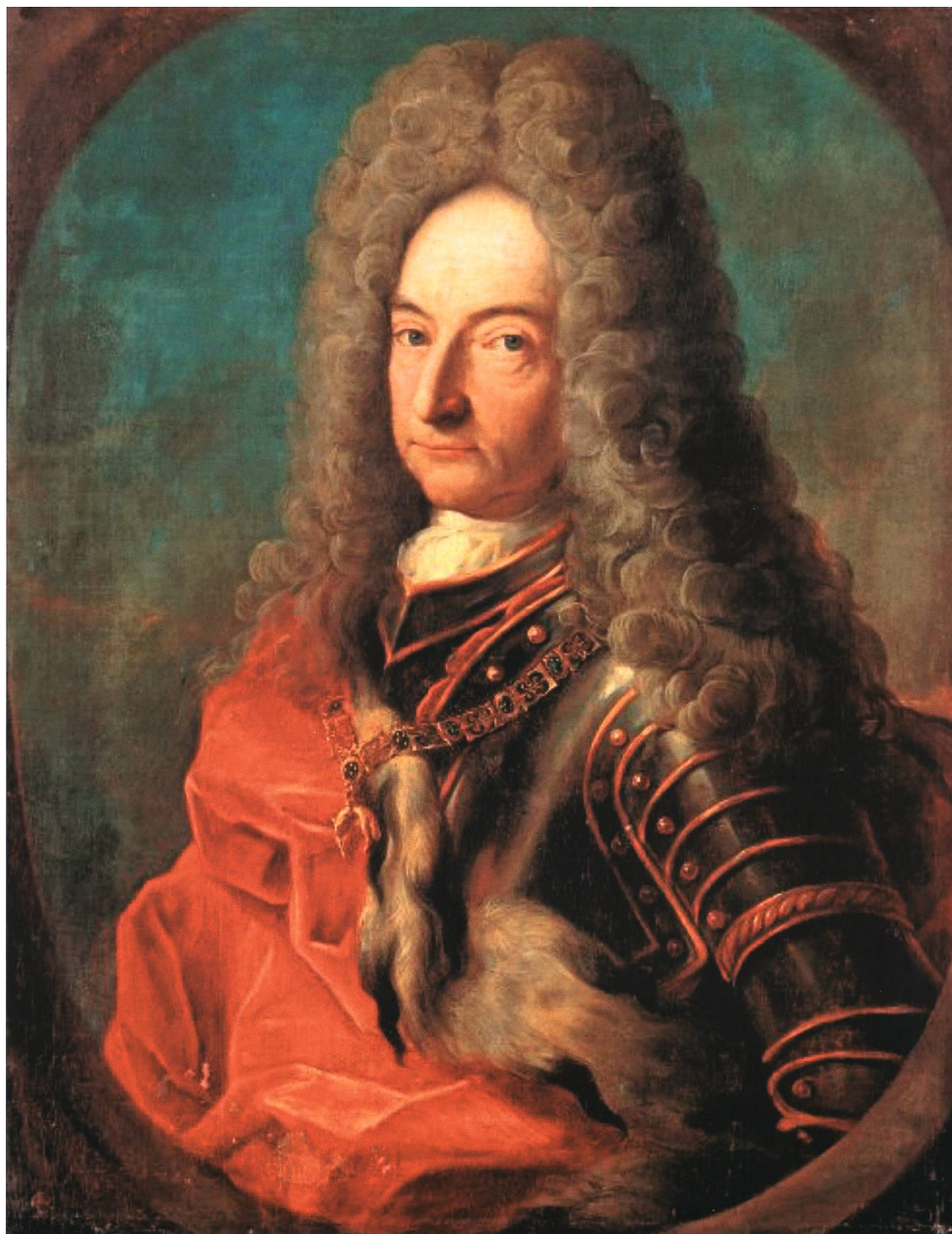
Anton Florian von Liechtenstein (1656–1721), «von Gottes Gnaden des Heiligen Römischen Reichs Fürst und Regierer des Hauses Liechtenstein». Auf seine Bitte vereinigte Kaiser Karl VI. die beiden Herrschaften Vaduz und Schellenberg am 23. Januar 1719 zu einem Reichsfürstentum und gab diesem den Namen des regierenden Hauses. Seine Dienstinstruktion von 1719 orientierte sich an absolutistischen Leitbildern. Ölgemälde eines unbekanntes Meisters.

Fürst Johann Adam I. starb am 16. Juni 1712, wenige Monate nach dem Kauf von Vaduz. In seinem Testament 62 vermachte er die beiden Herrschaften Vaduz und Schellenberg nicht seinem Nachfolger Anton Florian, dem gemäss geltender Primogenitur-Erbfolge nächsten regierenden Fürsten von Liechtenstein, sondern dem noch unmündigen Prinzen Josef Wenzel (geboren 1696) und dessen Nachkommen. Dies führte zu einigen Komplikationen. Der Grund ist nicht bekannt, es muss eine persönliche Feindschaft vermutet werden. 1717 ersuchte Josef Wenzel, der in Böhmen und Mähren grossjährig geworden war, den Kaiser, ihn auch in Reichsangelegenheiten aus der Vormundschaft zu entlassen. 63 Danach war er handlungsfähig und tauschte am 12. März 1718 mit seinem Onkel und künftigen Schwiegervater Anton Florian Vaduz und Schellenberg gegen die böhmische Herrschaft Rumburg, die weniger Ehren, aber grössere Einkünfte abwarf. 64 Mit diesem «Permutations-Contract» 65 wurden die dem