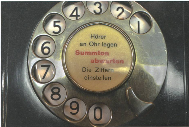
Beim Telefonapparat aus den 1940er-Jahren war es noch nötig, auf der Wahlscheibe die Anleitung zu geben, wie das Gerät zu bedienen ist.