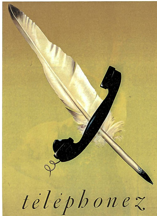
Werbekampagne vom Künstler Herbert Leupin aus dem Jahr 1941, entstanden im Auftrag von Pro Telephon .

Die Pro Telephon war mit ihren Werbemaßnahmen erfolgreich und so finden sich die Wurzeln der populären Telefonie in der Schweiz in den 1930er-Jahren, also in etwa zehn Jahre nach der Gründung der Vereinigung. Gerade die privaten Anschlüsse vermehrten sich in dieser Zeit ständig. Wurden im Jahr 1929 noch 60 Prozent der Anschlüsse von Handel und Industrie abgedeckt, waren es im Jahr 1954 nur noch 36.3 Prozent, während die Wohnungsanschlüsse von 20 auf 45.7 Prozent angestiegen waren. 17 Mit immer mehr Privatanschlüssen stieg das Ansehen und auch die Nachfrage nach einem eigenen Telefon, denn so konnte man