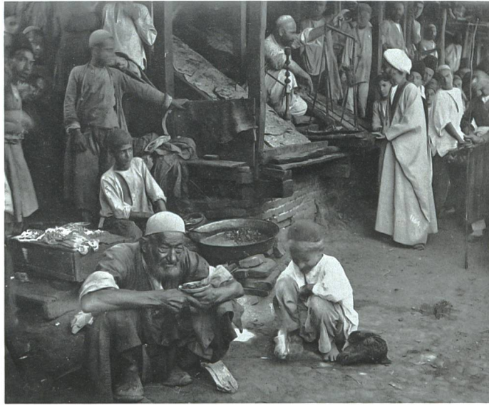
Brotverkäufer und Garküche im Basar von Rasht, unbekannter Fotograf, 1880–1895.