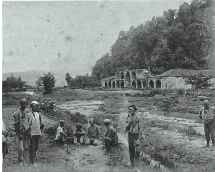
«Imamzadi Hashim [Emamzadeh Hashem]», eine kleine Siedlung diesen Namens auf der «Route de Rescht», 1880er-Jahre.