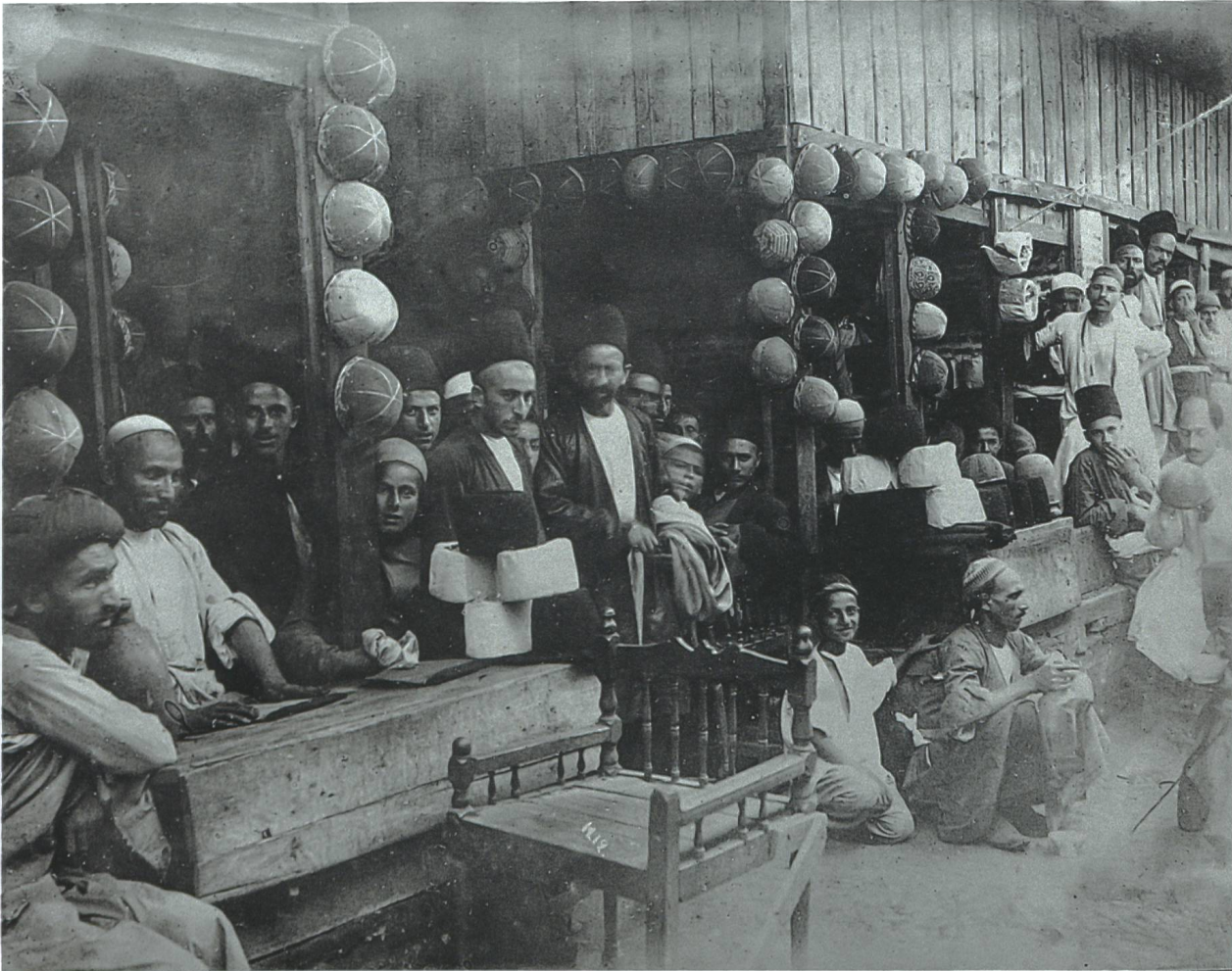
Die Stände der Hutverkäufer im Basar von Rasht, unbekannter Fotograf, 1880–1895.