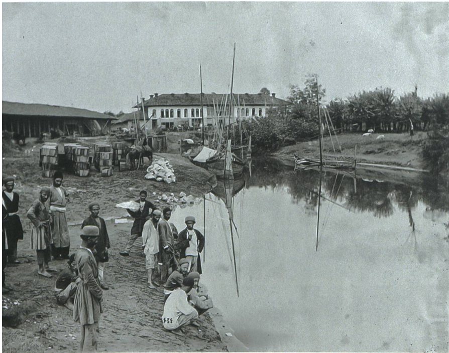
«Peri Bazar», 1880er-Jahre.

fer fuhr mich zurück nach Enzeli [Bandar Anzali, der wichtigste iranische Handels- hafen am Kaspischen Meer]. Im Peri Bazar miethete [ich] Pferde & nach ½stündigem Ritte kam ich mit starkem Fieber in Rescht an, wo [ich] 2 Wochen lang krank darnie- der liegen musste. Heuschreckenschwär-