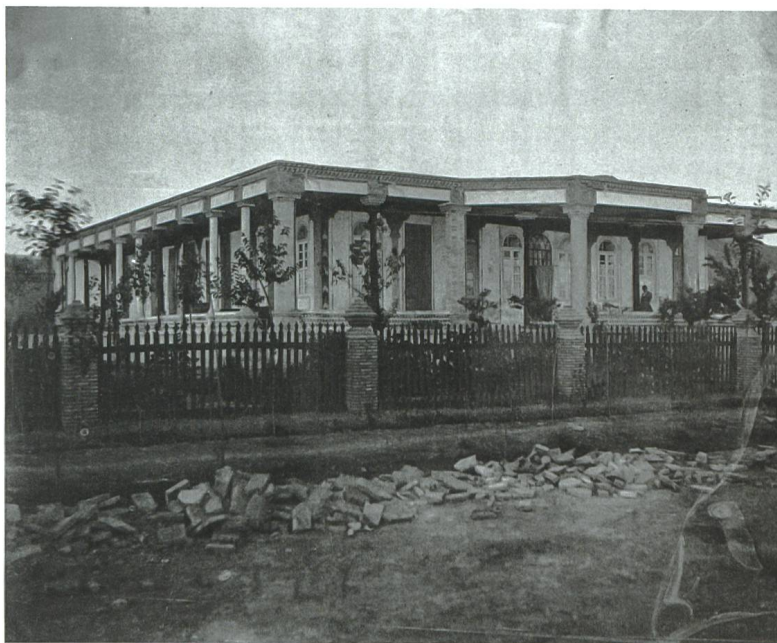
Oben: «Unser Wohnhaus in der Stadt», unbekannter Fotograf, 1880–1895.