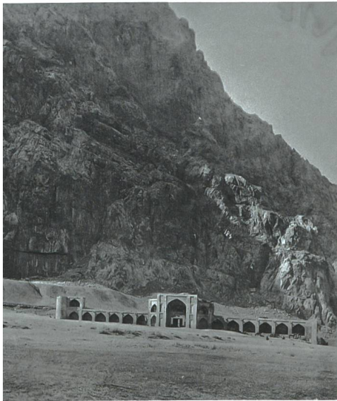
Verfallene Karawanserei in der Provinz Gilan, 1880–1895.