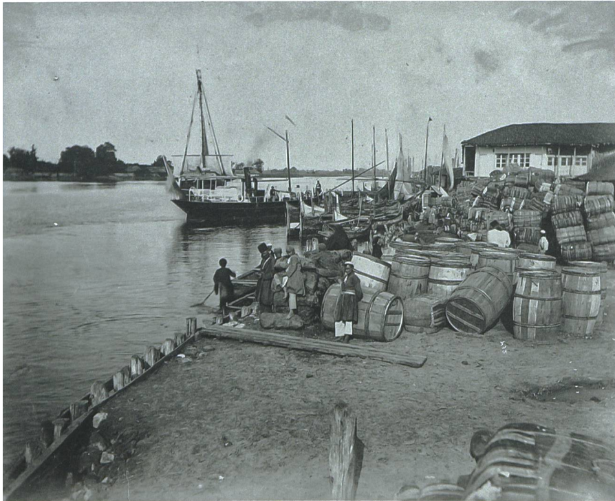
Der Hafen von Anzali, unbekannter Fotograf, 1880er-Jahre.