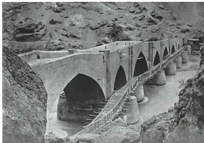
«Brücke v. Mendhil [Manjil]» im Süden der Provinz Gilan, 1880–1895.