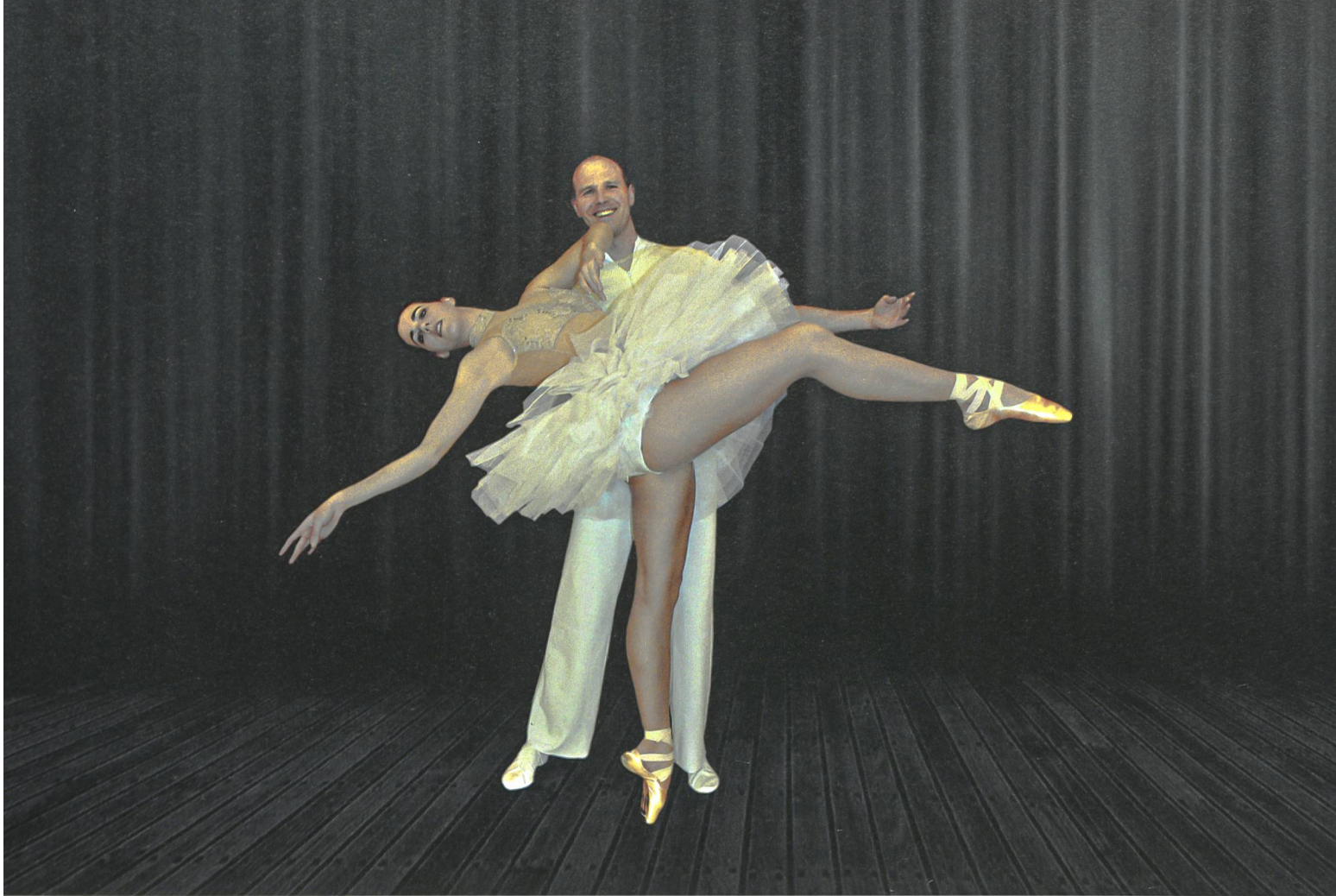
Die neu entdeckte Leidenschaft der Ballettpädagogin ist das Pas de deux – hier mit ihrem Tanzpartner.

die verschiedenen Ebenen von Ballett als performative Kunstform, welche Tanz, Bühnenbild, Musik, Kostüme und Schauspiel beinhaltet.