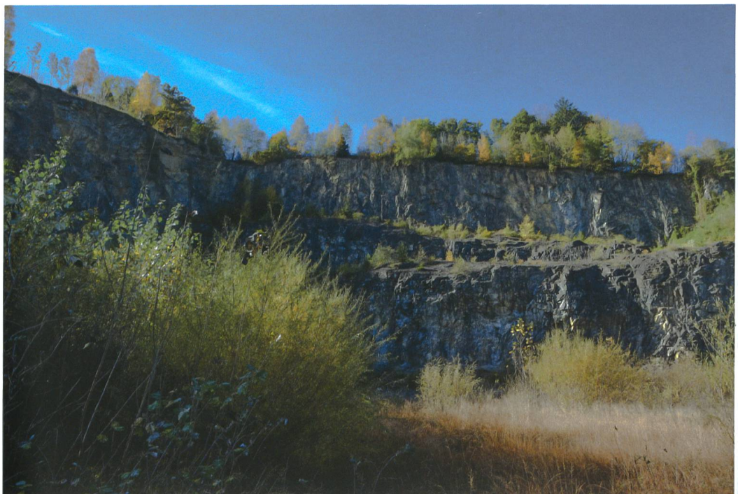
28.7.2018: Der Zugang zum Steinbruch Campiun musste aus Sicherheitsgründen verboten werden.