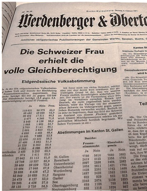
Eine ungewöhnlich fette Schlagzeile gab es am 8. Februar 1971, also am Tag nach der Abstimmung, im W&O.