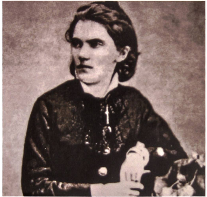
Die erste Schweizer Historikerin Meta von Salis-Marschlin hielt zahlreiche Vorträge in der ganzen Schweiz.

Im zweiten Teil seines Referats bekämpft er die beobachtete Toleranz gegenüber diesen «Sklavenhändlerpraktiken». Die geduldete Prostitution sei nicht nur ein grosser Irrtum, sondern der Grund für einen Teil der Übel der Gegenwart, «woran ganze Völker sichtlich zugrunde gehen. [...] Belastete, nervöse, geistes- und körperschwache Kinder, denen man keine rechte geistige und körperliche Anstrengung zumuten darf, eine völlige Abnahme von moralischer Kraft und idealer Gesinnung bei ganzen Nationen, das stammt alles aus dieser Quelle.» 14