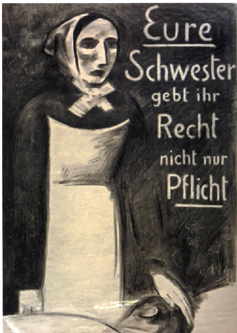
In den meist emotional geführten Diskussionen um das Frauenstimmrecht ging die rechtliche Argumentation nach Carl Hilty oft unter. Plakat von Pellegrini 1920.

Diese Kritik erinnert auch daran, dass ein Teil der bürgerlichen Frauenbewegung nur als Sittlichkeitsbewegung für moralische und gesellschaftliche Integration und bessere Lebensbedingungen eintrat, nicht aber für die politische Gleichberechtigung. 25