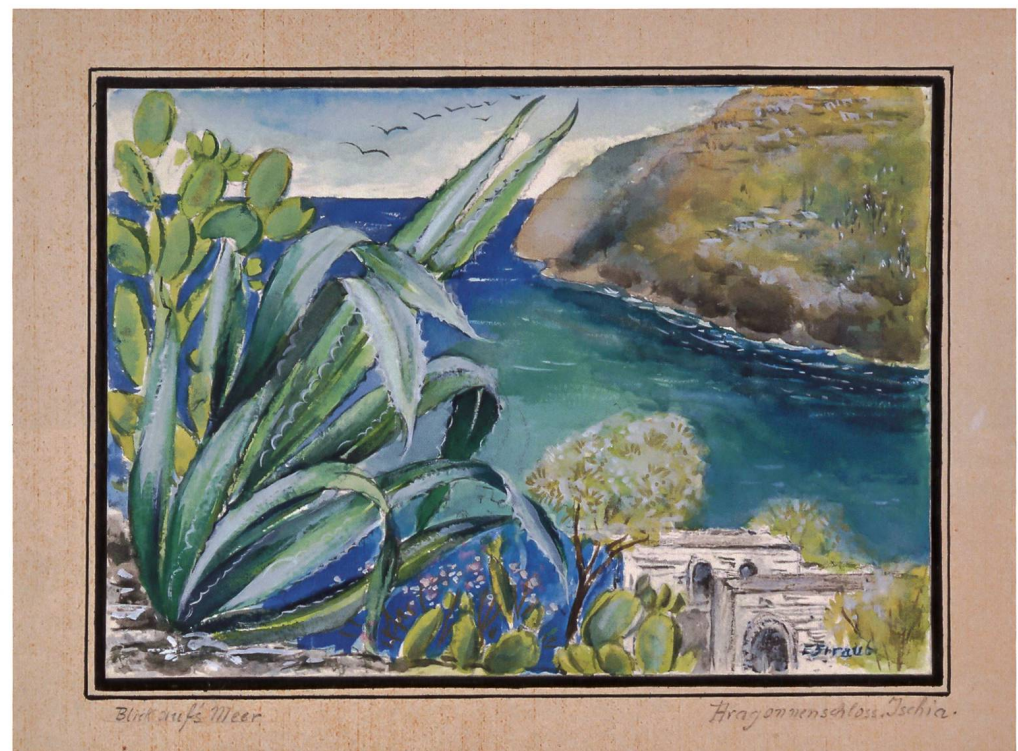
Blick auf's Meer mit Aragonnenschloss im Vordergrund. Zeichnung von einer Reise nach Ischia.