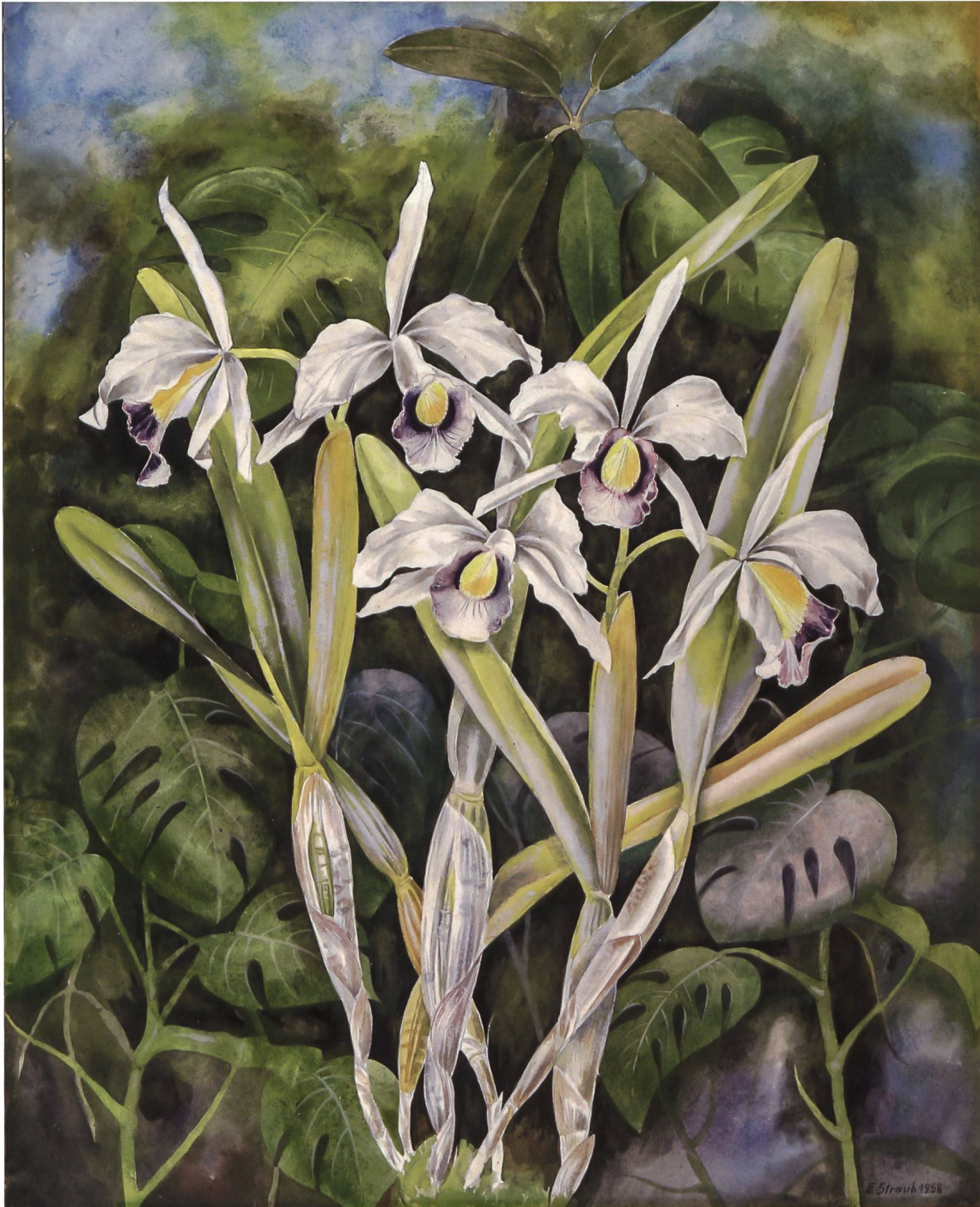
Blumenstilleben mit Orchideen, Gemälde von Ella Straub aus dem Jahr 1958.