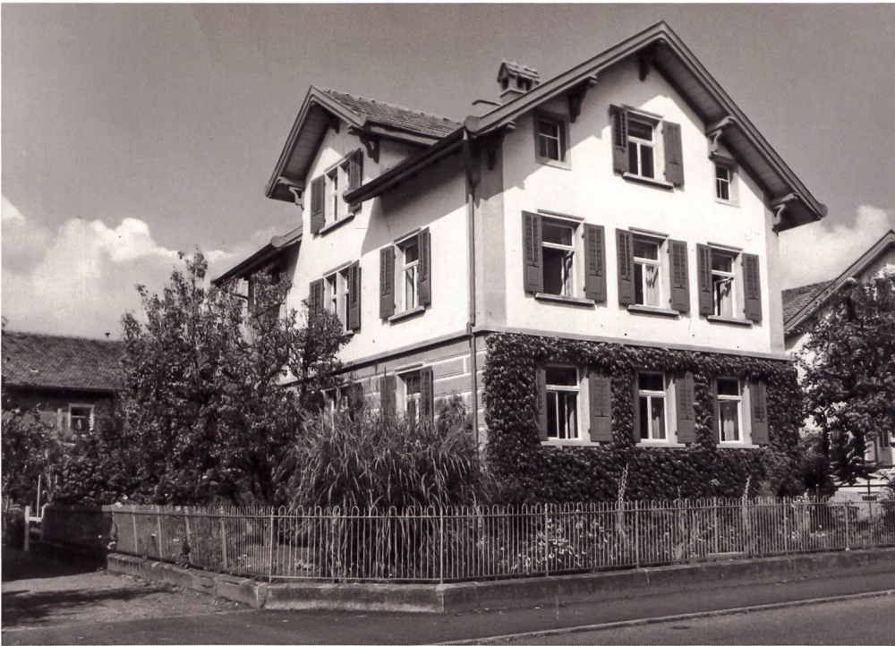
Ellas Elternhaus an der Kappelstrasse in Buchs, wo sie bis kurz vor ihrem Tod lebte (Aufnahme von 1959).