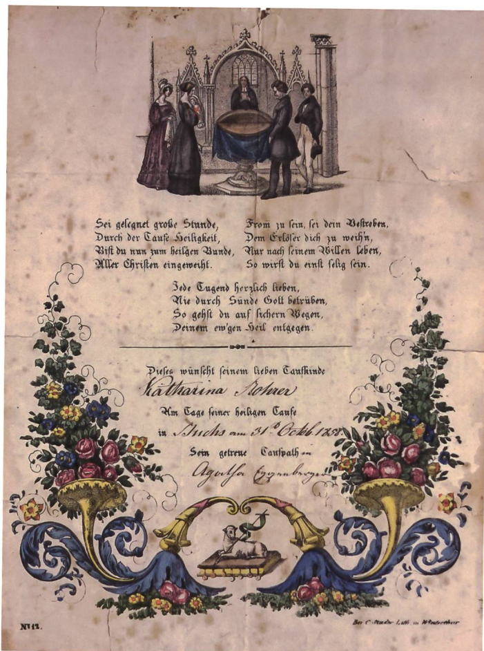
Taufzettel aus Buchs, 1858.