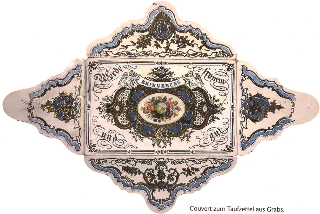
Couvert zum Taufzettel aus Grabs.