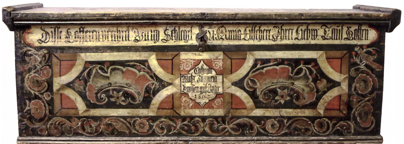
Das besondere Neujahrsgeschenk.

Dann wurde den Paten eine Weinsuppe gereicht: geröstete Brotwürfel, mit Zucker und Zimt bestreut und im Rotwein gekocht.