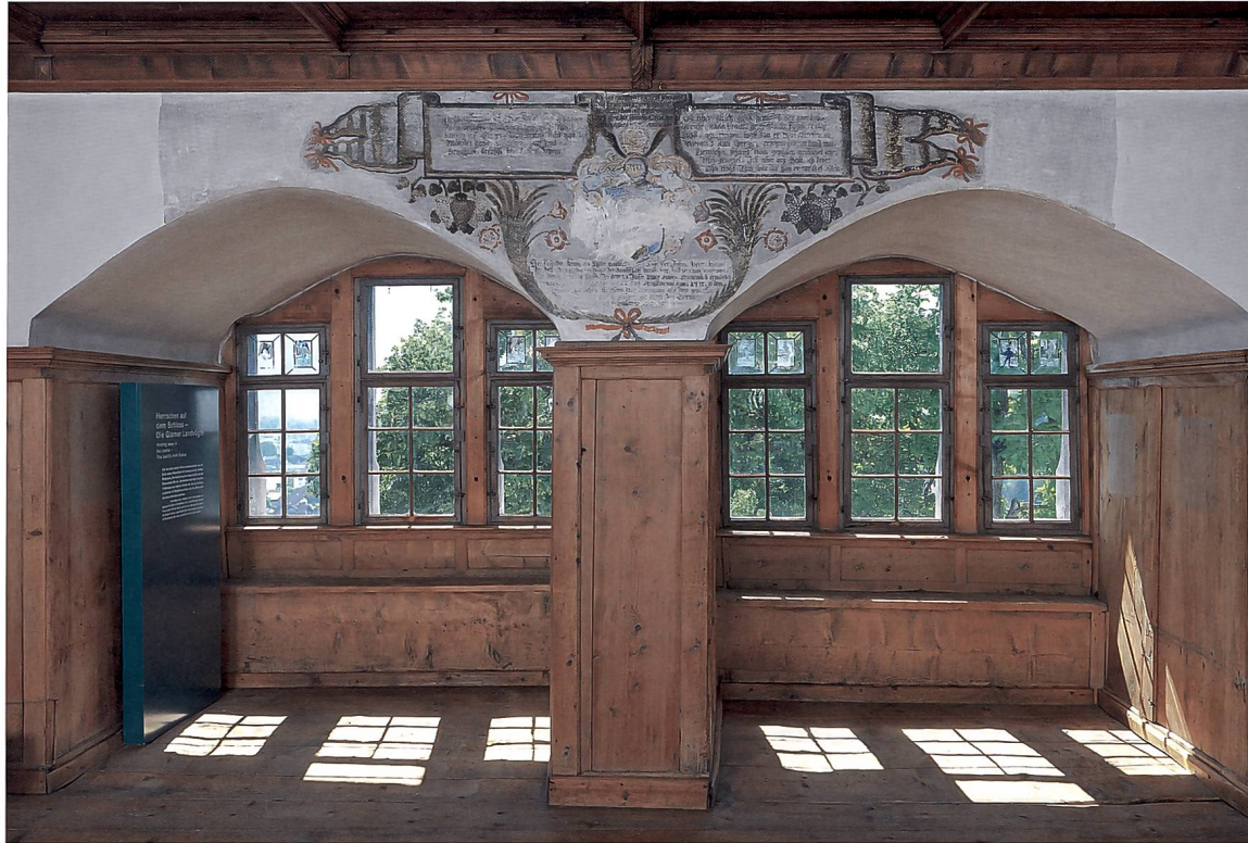
Landvogteistube im Schloss Werdenberg mit Klageschrift des Landvogts Johann Peter König von 1712.

Er solle Gott und der Obrigkeit die Ehre geben und alles göttlich bekennen. Hungler liess sich aber nicht erschrecken, und als seine Verwandten heftig gegen Tortur oder Folter protestierten und von König sogar eine Bürgschaft erhielten, liess ihn Scheuß ohne peinliche Befragung laufen.