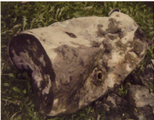
Eines der auf Schadstoffe untersuchten Fässchen der Deponie Criangga.

Ein erkranktes Schaf wird daraufhin untersucht, ob die Erkrankung auf Schadstoffe aus der Deponie zurückzuführen ist.