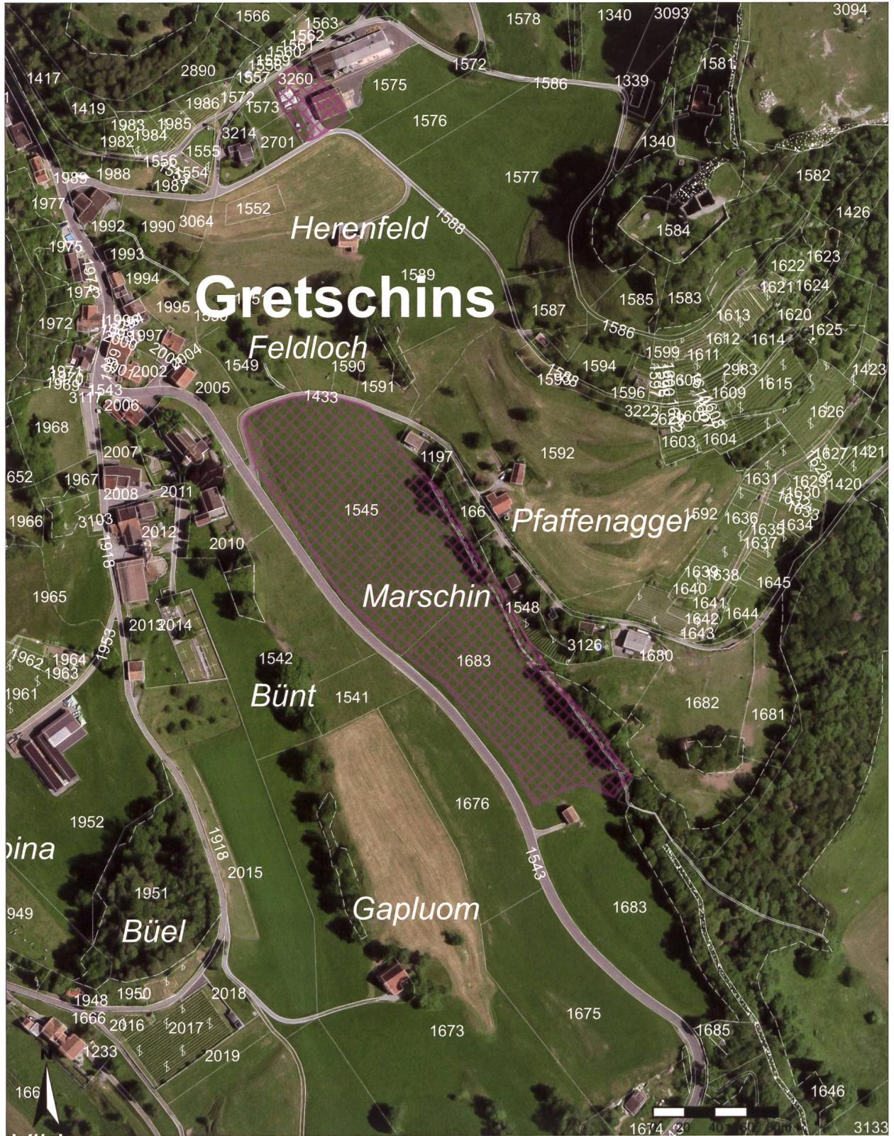
Auszug aus dem Kataster der belasteten Standorte (KbS) für die Deponie Criangga.