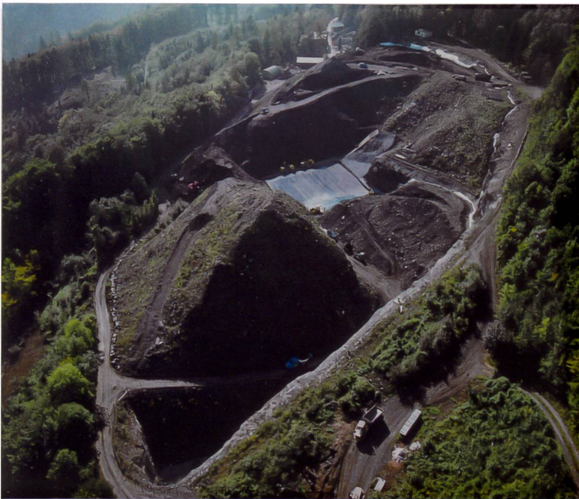
Sanierungsarbeiten Deponie Buchserberg 1997.

Schweiz durch den Bund auf Verordnungsstufe festgelegt, insbesondere werden technische und hydrogeologische Vorgaben für die Errichtung von Deponien sowie Grenzwerte für chemische Belastungen und Fremdstoffgehalte in Abfällen definiert.