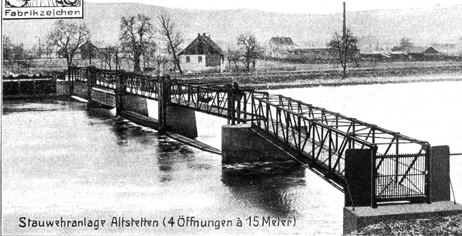
Stauwehranlage Altstetten (4 Öffnungen à 15 Meter)