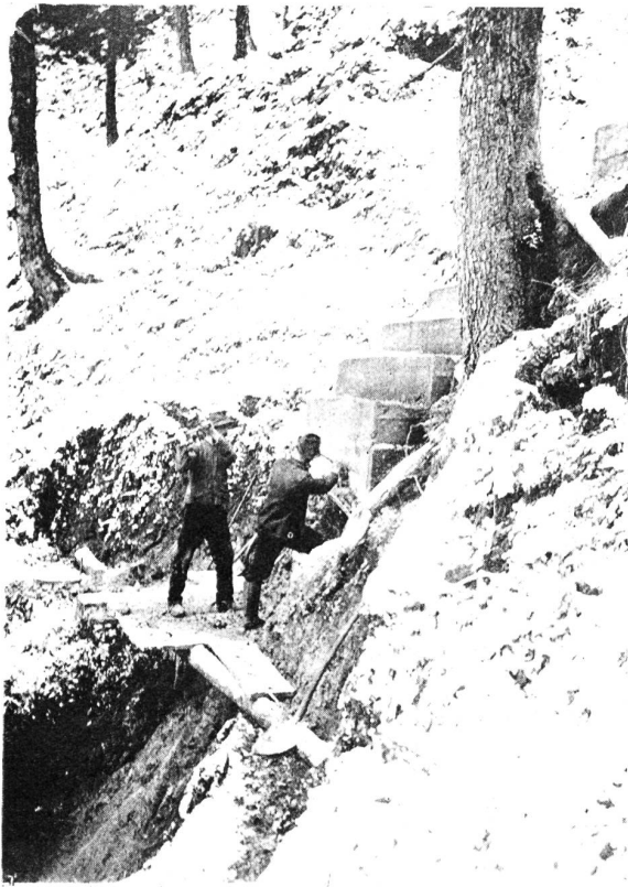
Das Alvierwerk. Abbildung 13. Fixpunkt C der Leerlaufleitung.