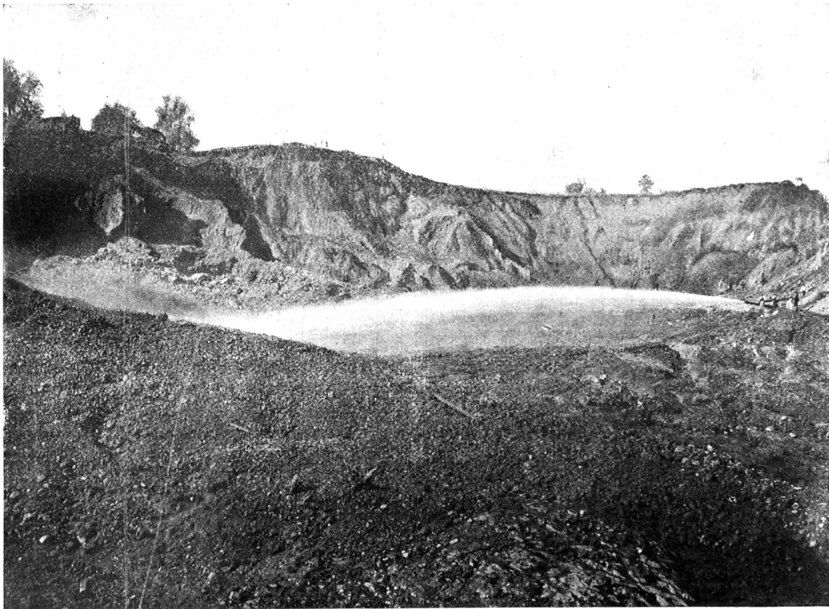
Der Necaxa-Damm. Figur 4. Schwimmen in der Lehmgrube.

Figur 4 zeigt einen Monitor in Funktion in der