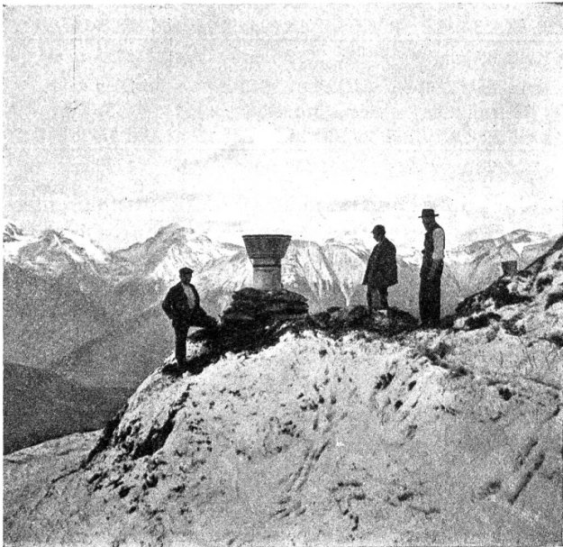
Fig. 5. Mougins-Totalisator der Landeshydrographie am Hotel Jungfrau 2250 m (Eggishorn).

Die schweizerische Landeshydrographie hat kürzlich an den Hängen des Eggishorns — ungefähr 50 m oberhalb des Hotels Jungfrau — einen Apparat Mougins aufgestellt. (Fig. 5.) Wir werden somit binnen kurzem ein Niederschlagsprofil quer durch das Berner Alpengebiet erhalten, da sich bereits auf