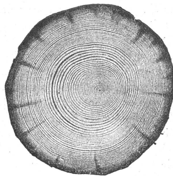
Abb. 2. Querschnitt von im Eintauchverfahren imprägnierter (Myanisierter) Rundhölzer.

bildungen 2 und 3 zeigen imprägnierte Rundhölzer, und zwar Abb. 2 Rundhölzer, die nach dem alten Eintauchverfahren mit Quecksilberchlorid imprägniert worden sind, während Abb. 3 Hölzer darstellt, die im Vakuum-Druckverfahren mit Teeröl imprägniert wurden, wie sie gegenwärtig im Wasserbau verwendet werden. Es ist deutlich zu erkennen, dass bei dem im Eintauchverfahren imprägnierten Stamm die Flüssigkeit nur in die äusseren Holzschichten eingedrungen ist,