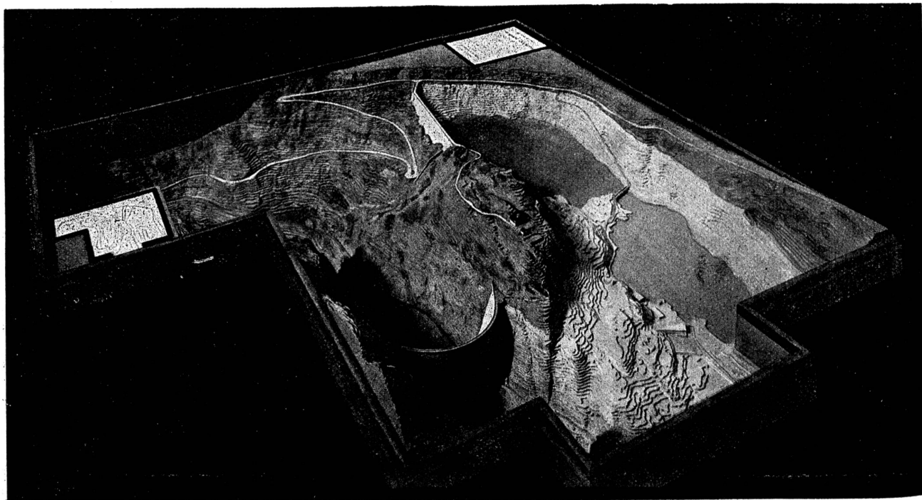
Ansicht der Grimselsperren von Westen

Die Grosszügigkeit der geplanten Anlagen kommt am augenfälligsten in den beiden Reliefs zum Ausdruck, die beide nach genauen Terrainaufnahmen hergestellt sind. Das eine stellt im Masstab 1:500 das Gebiet um das Grimselospiz dar mit den beiden Talsperren am Grim-