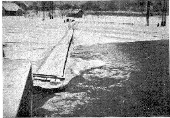
Abb. 4. Elektrizitätswerk Wangen. Unter der Eisdecke auftauchende Grundeismassen bei der Zentrale.