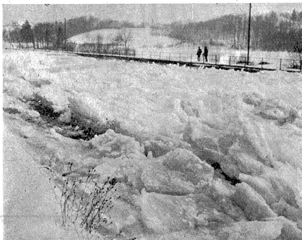
Abb. 5. Elektrizitätswerk Wangen. Packeis beim Fahrhöfli im Oberwasserkanal.

Durch die Eisanschoppungen wurde der Durchflußquerschnitt des Kanals immer kleiner, das Wasser gestaut. Man mußte den Zufluß zum Kanal reduzieren, um die Kanaldämme nicht zu gefährden. Der Betrieb mußte schließlich ganz eingestellt werden, um die im Kanal befindlichen Eismassen durch den Leerlauf abzuschwemmen. Die Abschwemmung begann am 14. Februar vormittags und dauerte bis 15. Februar vormittags. Obwohl dieser Leerlauf eine Breite von nur 6,0 m hat, konnte der Kanal in 24 Stunden gereinigt werden. Eine wesentliche Mithilfe war dabei nicht notwendig. Durch Lösen der großen Platten an den Kanalufeln und Zerkleinern besonders großer Platten vor dem Leerlauf wurde die Wirkung etwas beschleunigt. Am 15. Februar mittags war die Zentrale wieder normal in Betrieb, allerdings mit stark reduziertem Gefälle. Infolge der Eisanschoppungen im Staugebiet von Wynau stieg der Unterwasserspiegel am 12. Februar bis 2 m über Normal.