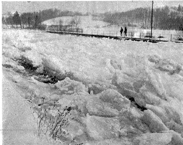
Abb. 5. Elektrizitätswerk Wangen. Packeis beim Fahrhöfli im Oberwasserkanal.

Durch die Eisanschnoppungen wurde der Durchflußquerschnitt des Kanals immer kleiner, das Wasser gestaut. Man mußte den Zufluß zum Kanal reduzieren, um die Kanaldämme nicht zu gefährden. Der Betrieb mußte schließlich ganz eingestellt werden, um die im Kanal befindlichen Eismassen durch den Leerlauf abzuschwemmen. Die Abschwemmung begann am 14. Februar vormittags und dauerte bis 15. Februar vormittags. Obwohl dieser Leerlauf eine Breite von nur 6,0 m hat, konnte der Kanal in 24 Stunden gereinigt werden. Eine wesentliche Mithilfe war dabei nicht notwendig. Durch Lösen der großen Platten an den Kanalufeln und Zerkleinern besonders großer Platten vor dem Leerlauf wurde die Wirkung etwas beschleunigt. Am 15. Februar mittags war die Zentrale wieder normal in Betrieb, allerdings mit stark reduziertem Gefälle. Infolge der Eisanschnoppungen im Staugebiet von Wynau stieg der Unterwasserspiegel am 12. Februar bis 2 m über Normal.