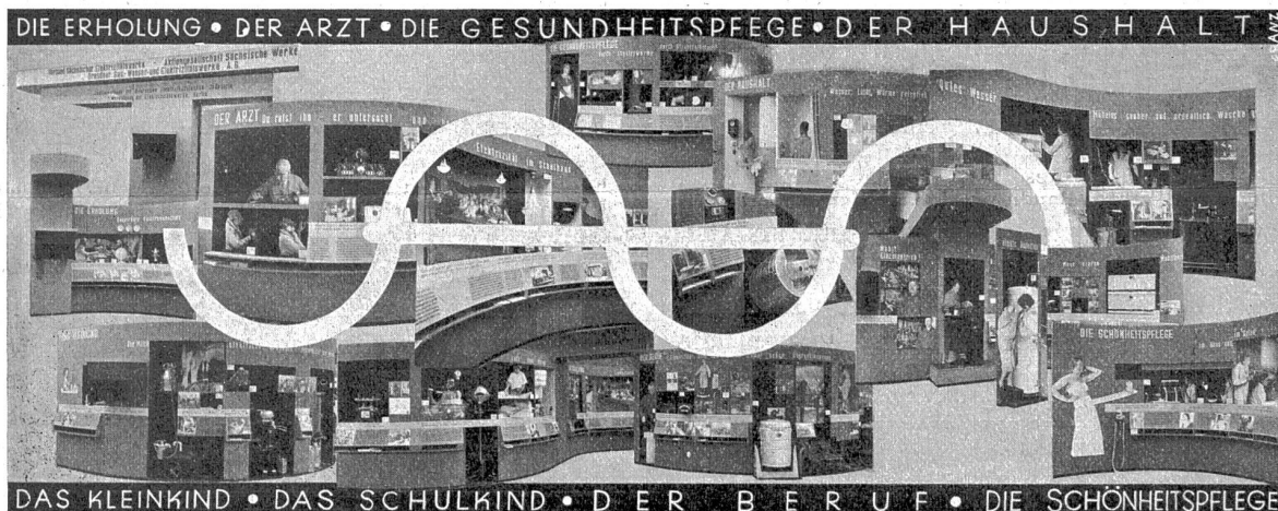
Die Elektroschau an der Internationalen Hygiene-Ausstellung in Dresden 1930.

Die Elektrizitäts-Ausstellung trägt den Titel „Elektrizität im Dienste der Hygiene“ und ist in