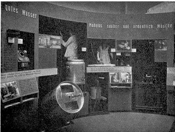
Elektrische Hygiene bei der Wäscherei.