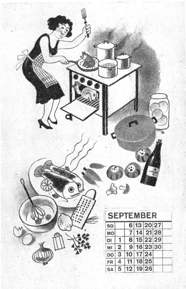
Abb. 5 Reproduktion eines Blattes des „Schweizer-Elektro-Kalenders“ für das Jahr 1932. Der im Format 19/31 cm hergestellte Kalender besteht aus zwölf zweifarbigen Blättern und einem künstlerisch ausgeführten Deckblatt. B.

«Die Fortbildungsschülerin». Periodisches Lehrmittel für die hauswirtschaftlichen und beruflichen weiblichen Bildungsanstalten, Arbeitsschulen, sowie für die eigene Fortbildung junger Schweizerinnen, die in Solothurn in einer Auflage von 9000 Exemplaren erscheint, hat soeben ein Sonderheft herausgegeben, betitelt: «Von der Elektrizität und ihrer Anwendung in der Küche und Heimbeleuchtung».