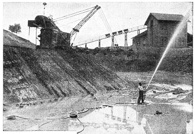
Abb. 79 Schwimmpumpe im Ziegelwerk zur Förderung von Lehmwasser aus der Grube.

Abb. 79 zeigt eine Schwimmpumpe im Ziegelwerk zur Förderung von Lehmwasser aus der Grube.