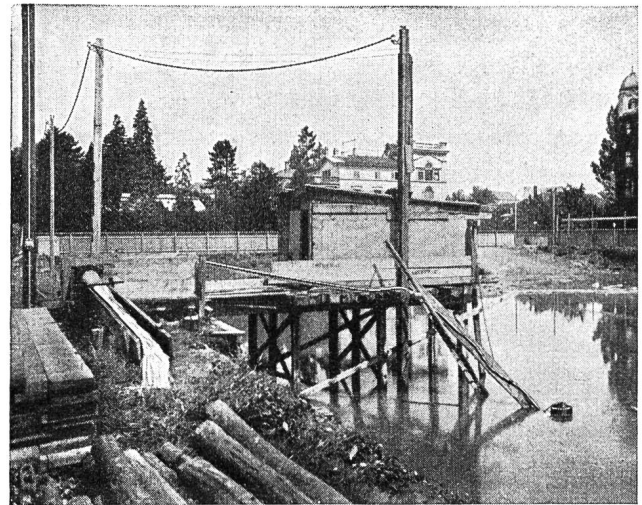
Abb. 81 Schwimmpumpe im Baugewerbe zur Förderung von Druckgrundwasser aus einer Baugrube.

Das Aufbaumaterial ist ein seewasserbeständiges Leichtmetall, geschützt gegen Rost, Säuren sowie Basen. Die maximalen Leistungen der verschiedenen Modelle betragen 5000, 7000, 18 000 und 36 000 st/l bei Gewichten von 18, 15, 30, 50 kg bei kleinstem Stromverschleiss.