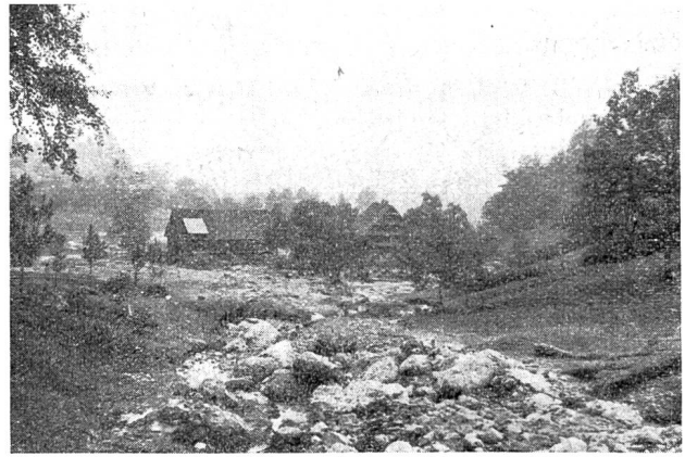
Abb. 5. Brüschbach bei Sattel.

Der Schluß des Berichtes enthält eine Aufstellung der angenäherten Kosten der Verbauungen, für die neue Kredite geschaffen werden müssen. Es handelt sich um eine Summe von 2,75 Mio. Fr., die für die Wiederherstellung