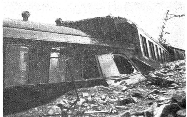
Abb. 1. Zug der SBB in der Rufe des Langweidbaches.