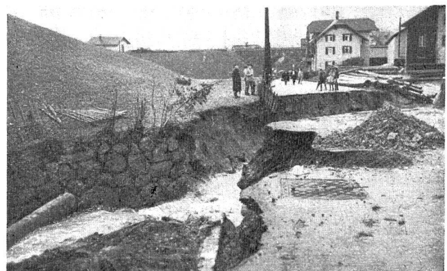
Abb. 3. Rigi-Aa und Kantonsstraße in Goldau.