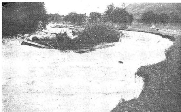
Abb. 2. Rigi-Aa bei der Gutwinde in Oberarth.

Im Bezirk Schwyz waren beteiligt der Fischkrattenbach, die Treichbäche, der Brennstudentenbach, Brechenbach, Langweidbach, Witeschrandbach, Blasersbach, Stadelmannsbach, Thurbach, Trehbach, Mühlebach, die Rigi-Aa das Ottenbächlein, der Steigenbach, der Sagenbach, Klausenbach, Rufibach und Grisselenweid-