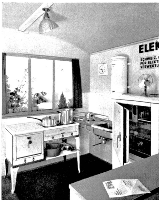
Fig. 28 Ausstellungszug 1936. Musterküche der «Elektrowirtschaft». Train exposition 1936. Cuisine modèle dans le stand de l'«Electrodifusion».

Der Kollektivstand der «Elektrowirtschaft», in dem kein ständiger Vertreter mitfährt, steht jeweils dem lokalen Elektrizitätswerk während den Aufenthaltstagen des Zugs zu Demonstrationszwecken zur Verfügung. Zu diesem Zweck ist ein besonderer Auskunftstand eingerichtet. Aus dem Urteil der Fach-