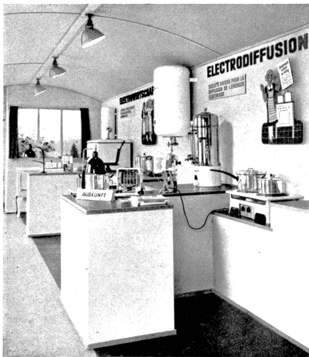
Fig. 27 Ausstellungszug 1936. Gesamtansicht des Standes der «Elektrowirtschaft». Train exposition 1936. Vue d'ensemble du stand de l'«Electrodifusion»

schränkten Raum eines Eisenbahnwagens stellt naturgemäss besondere Schwierigkeiten hinsichtlich der allgemeinen Disposition sowie der Anordnung der verschiedenen Apparate. Unter weitgehender Ausnützung des vorhandenen Raumes und Beschränkung auf die wesentlichsten Apparatetypen gelang es, zehn verschiedene Firmen in einheitlichem Rahmen zusammenzufassen. Von der «Therma» stammt z. B. die Ausrüstung für die vollelektrische Musterküche. Um die enge Begrenzung des Raumes zu durchbrechen, wurde über dem Herd der Musterküche als besondere Attraktion ein dreiteiliges Schiebefenster angebracht, das den Blick auf eine mit künstlichem Tageslicht angeleuchtete Landschaftsskizze freigibt. Die Firma «Maxim» zeigt einen Vierplattenherd mit eingebautem Grillheizkörper und der neuen Strahlungsplatte, ferner einen Heisswasserspeicher in normaler Ausführung sowie als instruktives Schnittmodell. Salvis ist mit einem Réchaud und einem Volksherd mit Grillplatte vertreten, Sauter durch einen 8 Liter «Schnellheizboiler»; Solis zeigt sein bekanntes Heizkissen sowie die Heissluftdusche in Isoliergehäuse. Weiter sind vertreten die Firmen Schindler, Luzern, mit einem Tischventilator, die «Therma» ferner durch Gross- und Kleinkaffeemaschinen und sonstige Kleingeräte sowie die Metallwarenfabrik Kuhn, Rikon, mit diversen Kochgeschirren. Als willkommene Helfer zur Erleichterung der schweren Hausfrauenarbeit zeigt