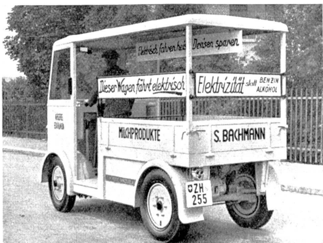
Fig. 47 Dieses Fahrzeug, ein Milchwagen in Eschlikon, Kt. Thurgau, mit einer Nutzlast von 1000 kg besitzt eine Geschwindigkeit von 20 km/h und einen Aktionsradius von 50—60 km pro Batterieladung. Der Wagen ist ausgerüstet mit einer Panzerplatten-Batterie, für die eine Garantie von 3 Jahren eingeräumt wird, in dem Sinne, dass die Kapazität nach Ablauf dieser Zeit noch mindestens 80% beträgt. Durch die Pneuberufung erhält der Wagen eine tadellose Abfederung, was auf die Lebensdauer der Batterie sich sehr günstig auswirkt. Der Erfolg, der am Tage der Stilllegung der übrigen Kraftfahrzeuge erzielt wurde, darf als ganzer gebucht werden, denn überall wurde dem Fahrzeug die grösste Aufmerksamkeit geschenkt. Die Lieferfirma, Elektrische Fahrzeuge A.-G., Zürich-Oerlikon, konnte inzwischen verschiedene Anfragen entgegennehmen, die auf diesen Propaganda-Feldzug zurückzuführen sind.