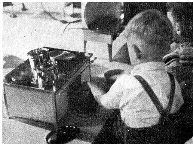
Fig. 5 Bereits im Jahre 1935 fand in Essen, im Rahmen einer Elektrowärme-Tagung des R. W. E., vom 22. bis 29. Mai eine «Elektrowoche» statt, die einen recht guten Erfolg verzeichnete. Bild links: Werbewagen der Essener Strassenbahn für die «Elektrowoche». Bild rechts: Elektrische Kinderküche an der Elektrowärmeausstellung. «Semaine de l'électricité», organisée en 1935, à Essen, dans le cadre d'un Congrès d'électrothermie du R. W. E. A gauche: une voiture de propagande des tramways municipaux. A droite: une cuisinière électrique pour enfants à l'exposition des applications électrothermiques.