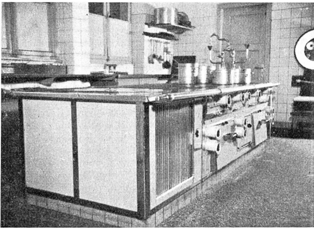
Fig. 1 Elektrische Thermo-Grossküchenanlage in einem Bahnhofbuffet des Kreises III der S. B. B.

ist, sodass nachts mit nur 8 kW aufgeheizt werden kann. Der Speicher hat den Heisswasserbedarf für den ganzen Betrieb zu decken, d. h. für Küche, Office, alle Reinigungszwecke und für die Lavabos.