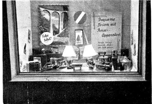
Fig. 11 Schaufenster der Lichtwerke und Wasserversorgung der Stadt Chur. Vitrine du Service de l'Electricité et des Eaux de la Ville de Coire.