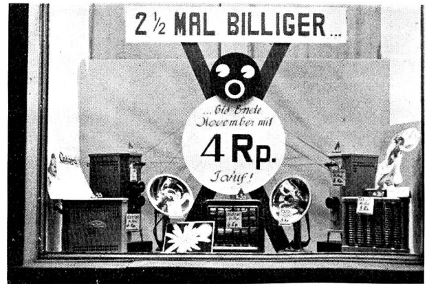
Fig. 12 Schaufenster der Lichtwerke und Wasserversorgung der Stadt Chur. Vitrine du Service de l'Electricité et des Eaux de la Ville de Coire.