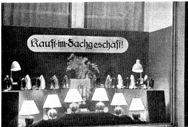
Fig. 10 Schaufenster der Lichtwerke und Wasserversorgung der Stadt Chur. Vitrine du Service de l'Electricité et des Eaux de la Ville de Coire.