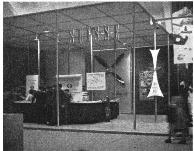
Fig. 37 Der Stand der Schweiz an der «Foire de Paris»

Dass die Schweizer Firmen, die sich an der «Foire de Paris» als Aussteller beteiligten — es waren etwa 30 an der Zahl — einen guten Werbeerfolg erzielten, ist nicht zu bestreiten. Der kommerzielle Erfolg war aber relativ bescheiden. Das gilt insbesondere für die Teilnahme der schweizerischen Elektroindustrie, die im ganzen durch vier Firmen vertreten war. Die Stände dieser vier Firmen waren fast immer von einer Menge, zum Teil seriöser Interessenten umlagert, aber leider konnte es zu keinem Abschluss kommen, ganz einfach, weil der schweizerischen Elektroindustrie bisher von französischer Seite noch keinerlei Einfuhrkontingente bzw. Kredite eingeräumt worden sind. Die Vertreter der Schweizer Firmen in Paris — meist handelt es sich um Konzessionäre am Platze — fanden zwar ihre alte Kundschaft wieder und dazu manchen neuen Kunden, der bereit und in der Lage gewesen wäre, grössere Aufträge zu erteilen. Aber da jede sichere Grundlage, sowohl für die Einfuhrmöglichkeiten elektrischer Apparate und Maschinen, als auch jeder Anhaltspunkt für genaue Preiskalkulation fehlte, da die Schweizer Firmen vor allem nicht wissen, ob ihnen die neugegründete französische Ausgleichskasse, die «Caisse de Péréquation», in die jeder französische Importeur den Unterschied zwischen In- und Auslandpreisen ein-