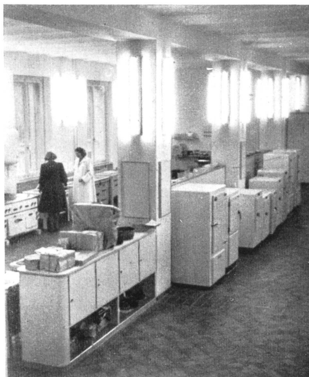
Fig. 39 In den hellen und freundlichen Ausstellungsräumen erscheinen die Geräte besonders begehrenswert.

Die ganze Disposition der Schau ist übersichtlich und anziehend und die Erfahrung hat gezeigt, dass der Besucher gerne verweilt. Er kann dabei ungestört