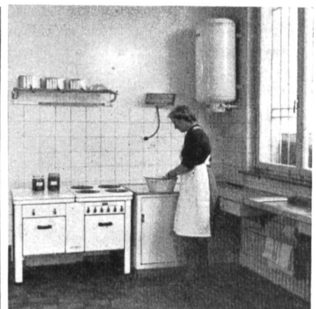
Fig. 43 Auch eine Musterküche fehlt nicht.