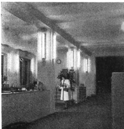
Fig. 41 Der zentrale Ausstellungsraum.

«Im Moment ihrer Gründung war man erfüllt von den Sorgen um die Sicherstellung einer ausreichenden Beschäftigung im Gewerbe nach Kriegsende. Die gefürchteten Nöte sind aber bis heute im Elektrogewerbe nicht eingetreten. Das Elektrogewerbe wurde im Gegenteil während langer Zeit bis an die Grenzen seiner Leistungsfähigkeit angespannt. Die Schwierigkeiten sind aber auf dem Gebiet der Energieversorgung entstanden. Es stellt sich die Frage, ob unter solchen Umständen eine Elektroschau zu rechtfertigen ist. Das ist zu bejahen, da die Nachfrage nach elektrischen Einrichtungen immer vorhanden ist, sei es für die laufenden Erneuerungen in Gewerbe und Haushalt, sei es zur Deckung des Bedarfs in Neubauten. Für alle diese Bedürfnisse ist es Aufgabe des Fachgewerbes, für eine möglichst zuverlässige