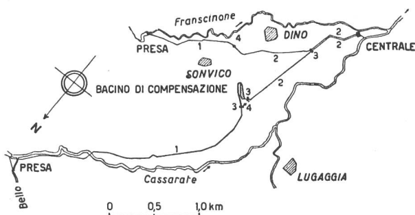
Abb. 1 EW Massagno. Ubersichtsplan. 1 : 80000.

Das bestehende Maschinenhaus ist mit drei Maschineneinheiten von zusammen 3150 PS installierter Leistung ausgerüstet. Die Installationen ermöglichen eine jährliche Energieproduktion von ca. 3 Mio kWh.