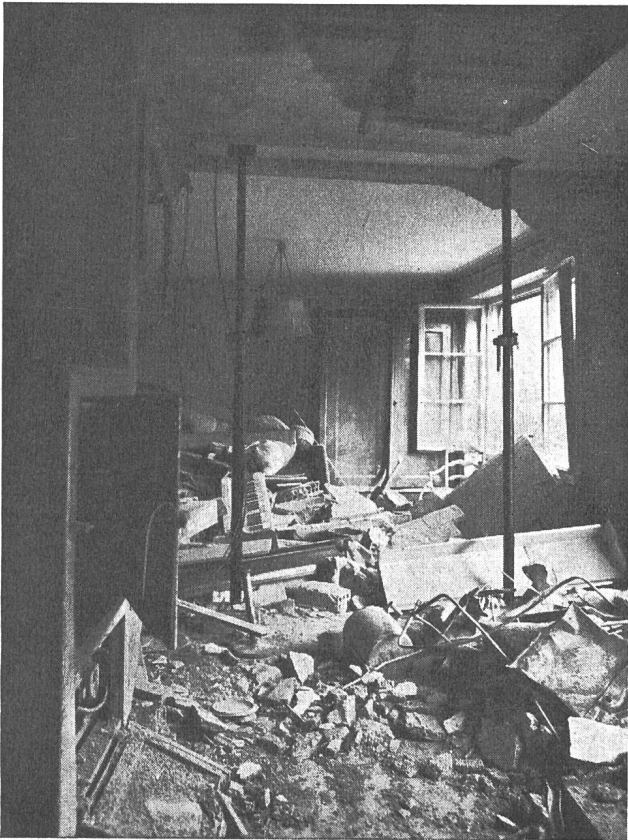
Fig. 20 Die Mauer, an der der Herd stand, wurde mit Wucht in das dahinterliegende Zimmer geworfen. Das zerstörte Klavier zeigt die Wucht der Explosion.

störungen am ebenfalls in jenem Raum befindlichen Klavier lassen keinen Zweifel über das Schicksal offen, das einen Schläfer in jenem Bett betroffen hätte.