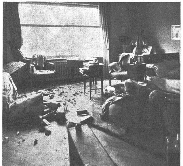
Fig. 22 Blick in das der Küche gegenüberliegende Schlafzimmer.

Der Pilum-Herd, der einige Zeit später in Solothurn explodierte, hat bei weitem nicht die selbe verheerende Wirkung gehabt.