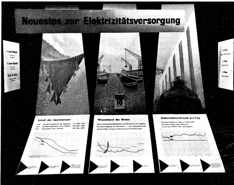
Fig. 5 Ansicht des Schaufensters mit den Darstellungen zur Elektrizitätsversorgungslage, bei der Schweiz. Bankgesellschaft, Bahnhofstrasse 45, Zürich.