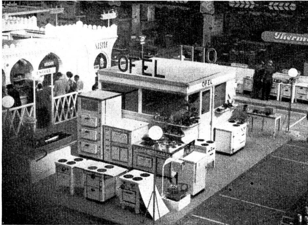
Fig. 20 Vue d'ensemble du stand d'OFEL au Comptoir Suisse de 1948.

Mitteilungsblatt der «Elektrowirtschaft», Schweiz. Gesellschaft für Elektrizitätsverwertung - Beilage zur «Wasser- und Energiewirtschaft» - Redaktion: Bahnhofplatz 9, Zürich 1, Telefon 27 03 55 - Briefadresse: Postfach Zürich 23