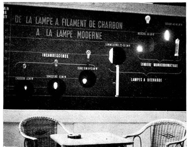
Fig. 21 Le tableau montrant les progrès de la lumière électrique.

En résumé, le stand conçu cette année sur une base thématique a causé une bonne impression et en contribuant à faire connaître le gros effort entrepris en vue d'accroître rapidement et par tous les moyens la production d'électricité, il paraît avoir rempli l'une de ses principales missions.