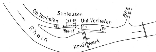
Fig. 3 Birsfelden sur le Haut-Rhin, projet.