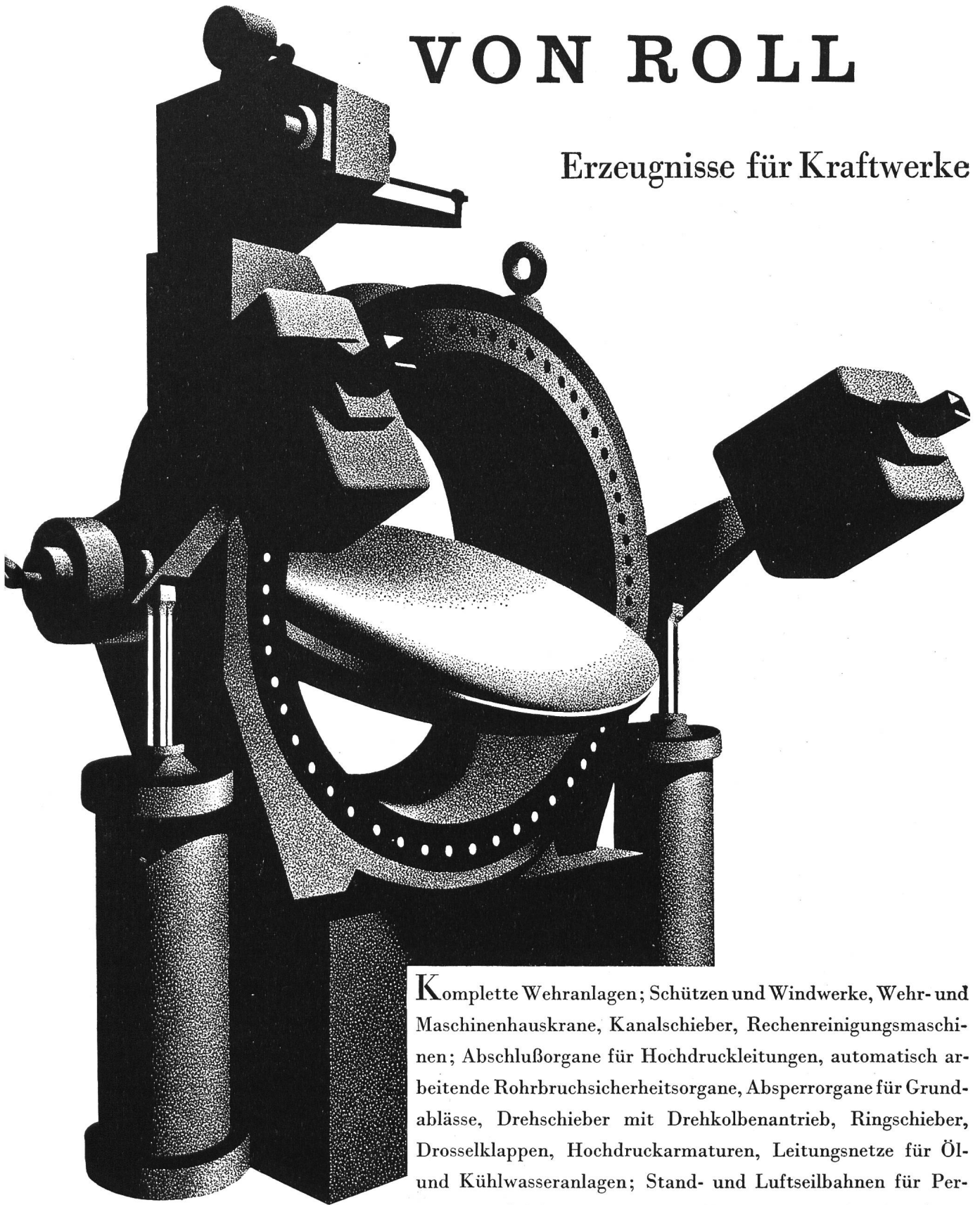
Drosselklappen für Druckleitungen, bei Rohrbruch automatisch schließend

K omplette Wehranlagen; Schützen und Windwerke, Wehr- und Maschinenhauskrane, Kanalschieber, Rechenreinigungsmaschinen; Abschlußorgane für Hochdruckleitungen, automatisch arbeitende Rohrbruchsicherheitsorgane, Absperrorgane für Grundablässe, Drehschieber mit Drehkolbenantrieb, Ringschieber, Drosselklappen, Hochdruckarmaturen, Leitungsnetze für Öl- und Kühlwasseranlagen; Stand- und Luftseilbahnen für Personen- und Materialtransporte; Baumaschinen für den Stauwehrbau.