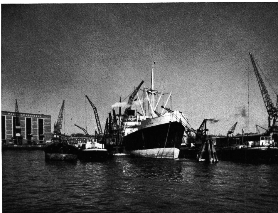
Hafen von Rotterdam, Umlad von einem Hochseedampfer auf einen Rheinkahn.

Die Schweiz kann keine Hand bieten zu Lösungen,