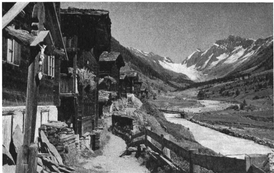
Blatten im Lötschental gegen Langgletscher

En conclusion de cet aperçu, il y a lieu de constater que le problème de la régularisation du lit d'un cours d'eau et de la protection des berges offre une variété extraordinaire de solutions, chaque torrent ayant son caractère particulier et qu'une formule type ne peut être appliquée.