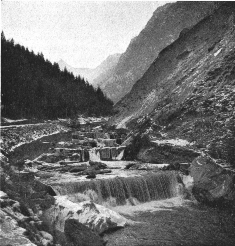
Fig. 2 La Viège de Zermatt au Kipfen

de ceci qu'en 60 jours seulement, le centre du Valais a reçu 299 mm d'eau, alors que la moyenne annuelle pour la région de Sion est de 590 mm.