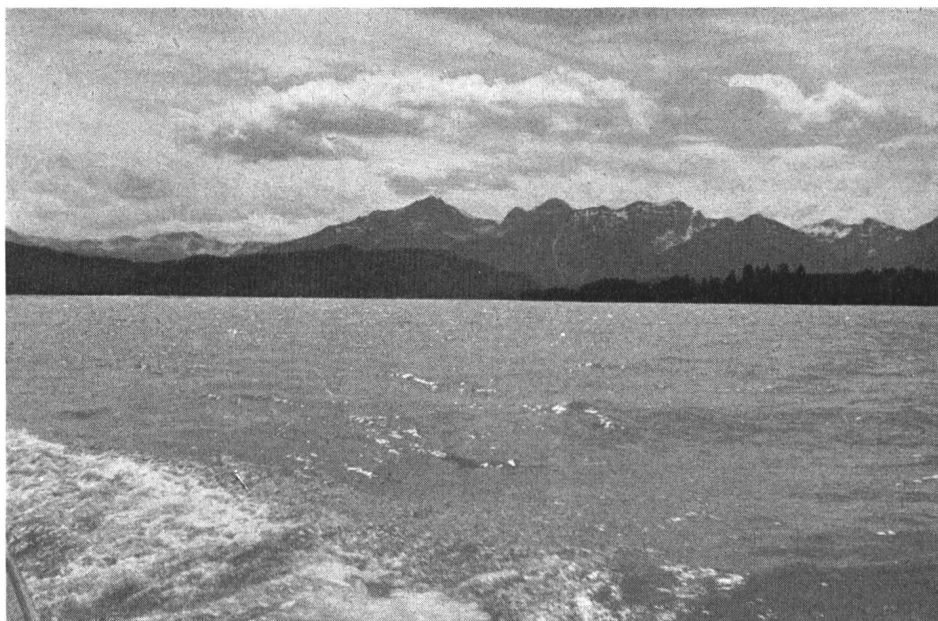
Abb. 2 Der neu geschaffene, erstmals gestaute große Lechspeicher Roßhaupten (Forggensee) bei Füssen in Bayern

Die Vortragsreihe eröffnete Sektionschef E. Hartig von der obersten Wasserrechtsbehörde Wien mit dem Thema «Internationale Wasserwirtschaft und internationales Recht» 1) , wobei er auf die Tatsache hinwies, daß es kein generelles internationales Wasserrecht gibt. Das Befassen mit internationalen Wasserrechtsfragen führte bisher nur zur Aufstellung von Doktrinen. Die Behandlung der konkreten Probleme, die seit mehr als einem halben Jahrhundert auftauchen, lassen bloß Prinzipien aufkommen und Begriffe definieren. Die Tatsache des Fehlens eines internationalen Wasserrechtes ist einerseits auf die Kompliziertheit der Materie, durch die jeder Einzelfall individuelle Prägung trägt, andererseits auf Mangel an universalistischem Denken zurückzuführen. Die sich stellenden Probleme wurden bisher vorwiegend durch bilaterale Verträge gelöst, die sich fallweise als lückenhaft erwiesen.