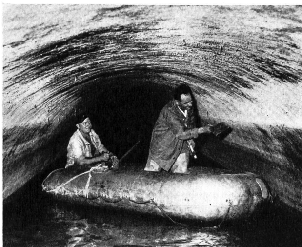
Fig. 2 Travaux d'entretien dans un égout moderne, sections 2,80/2,20 m

Ce dégrillage comporte une passe unique de 3,00 m de largeur, équipée également d'un dégrilleur automatique. Les produits retirés sont acheminés vers la dilacération ci-dessus.