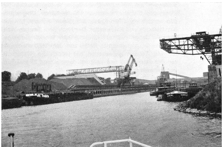
Fig. 4 Verladeanlagen in einem der vielen grossen Hafenbecken mit insgesamt 45 km Quailänge im Hafen Duisburg-Ruhrort