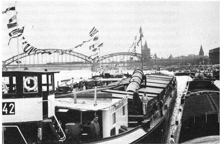
Fig. 1 und 2 Überblick über die Schau moderner Güterschiffe am linken Rheinufer in Köln; Blick stromaufwärts und stromabwärts.