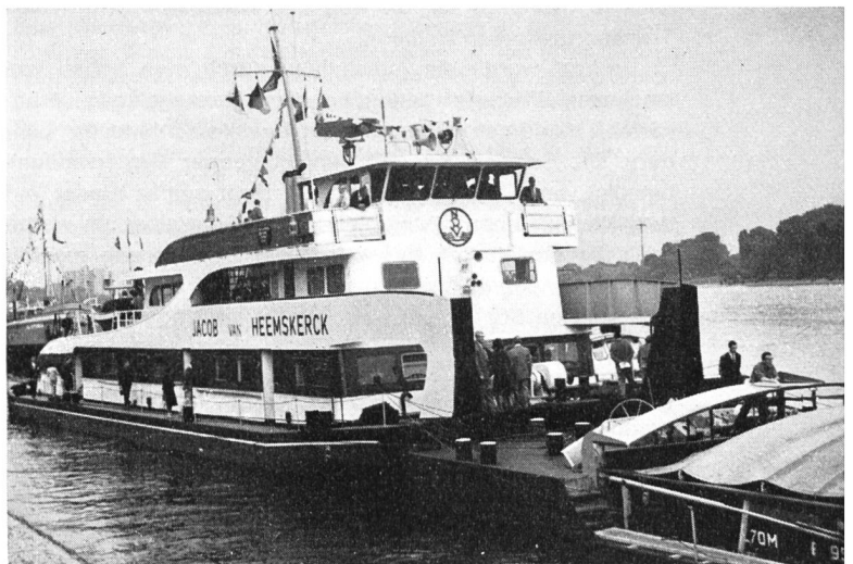
Fig. 3 Schubschiff in Verbindung mit Schubleichter

An Hand von Modellen, Schautafeln und Grossfotos wurde in einem ideellen Teil die Bedeutung des Verkehrsträgers Binnenschiffahrt eindrucksvoll zur Darstellung gebracht. Auch hatten Schiffahrtsverbände ihre besonderen Arbeitsgebiete, Projekte und Probleme augenfällig aufgezeigt.