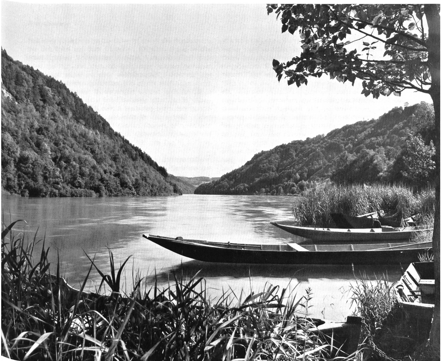
Bild 1 Am Hochrhein im Staugebiet des Kraftwerkes Eglisau.