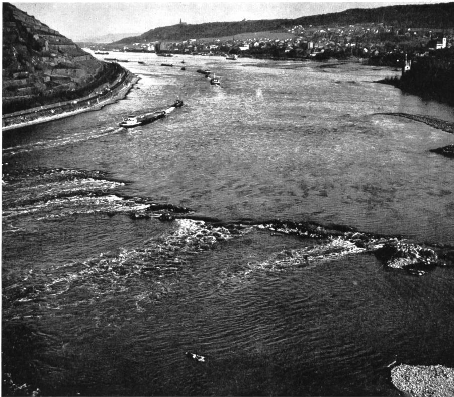
Bild 8 Die Felsbänke am Binger Loch

über die Anwendung des EWG-Vertrages auf die Rheinschifffahrt hat die EWG-Kommission zwar den Standpunkt vertreten, dass die von ihr beabsichtigten Massnahmen auf dem Verkehrssektor weder die Freiheit der Schifffahrt noch die Freiheit des Handels beeinträchtigen, jedoch ist diese Auffassung mehr als umstritten. Ein besonderes Problem stellt hierbei die Stellung der Schweiz dar, die zwar Mitglied der Zentralkommission für die Rheinschifffahrt, der Hüterin der Mannheimer Akte, jedoch nicht der Europäischen Wirtschaftsgemeinschaft ist.